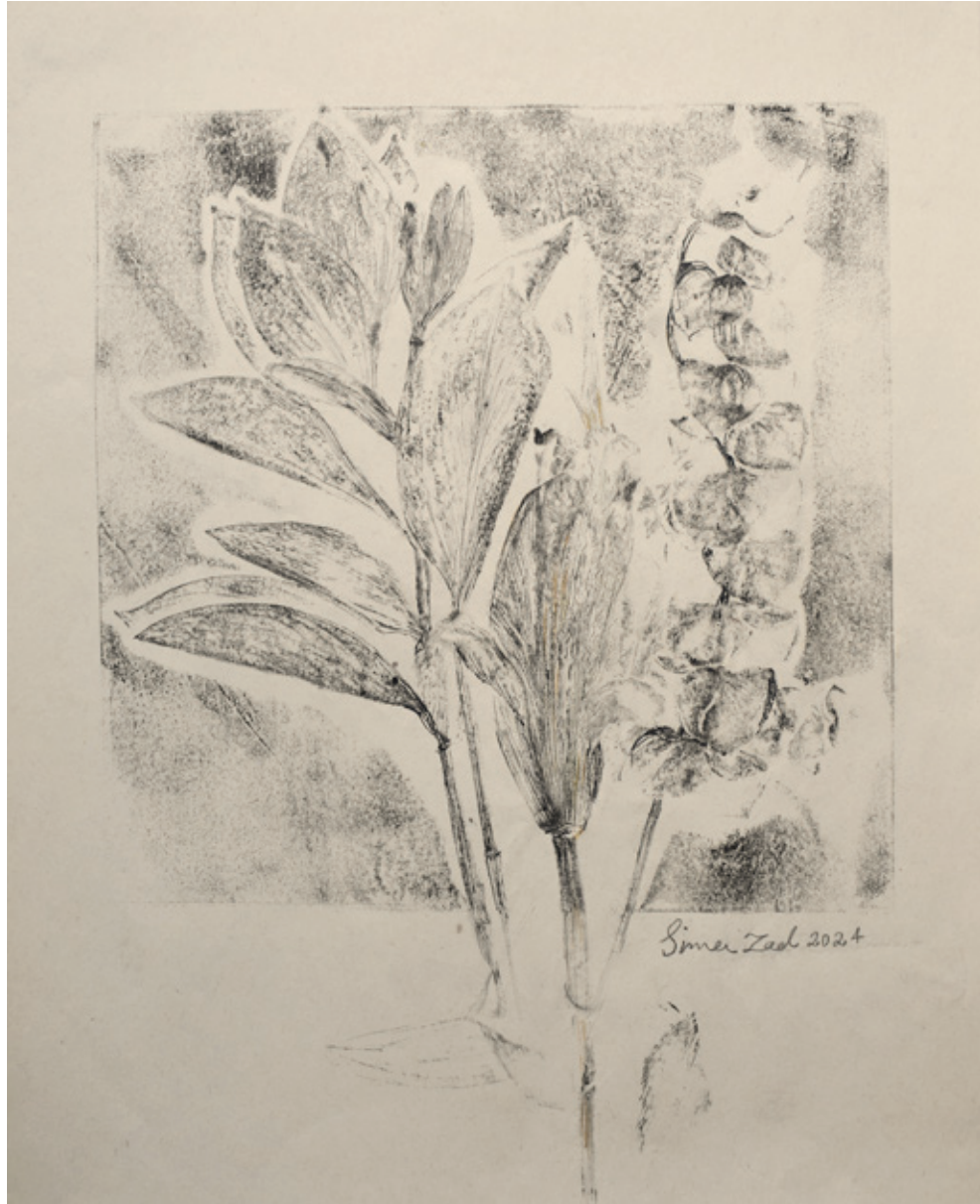
Untitled | 22 x 26 | Mixed Media on Paper