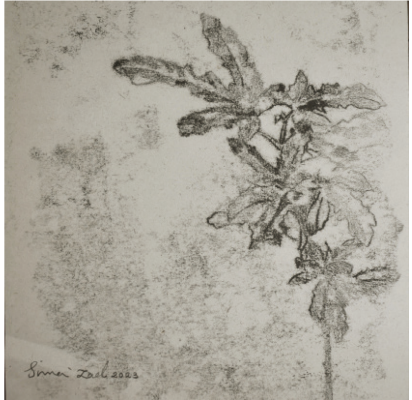
X Untitled | 17 x 17 | Mixed Media on Paper