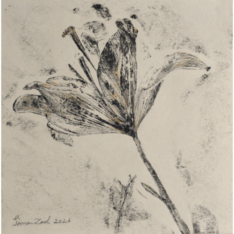
X Untitled | 17 x 17 | Mixed Media on Paper