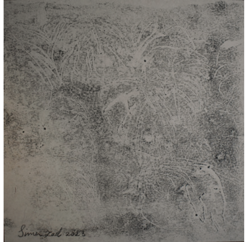
X Untitled | 17 x 17 | Mixed Media on Paper