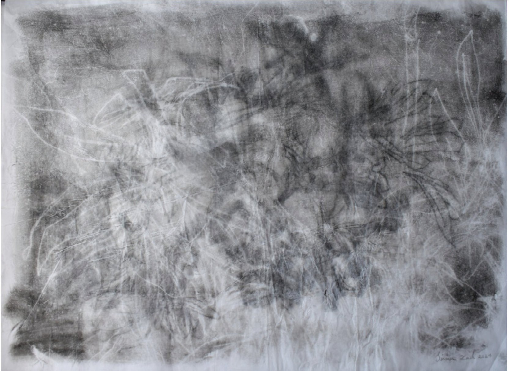
Untitled | 50 x 70 | Mixed Media on Paper