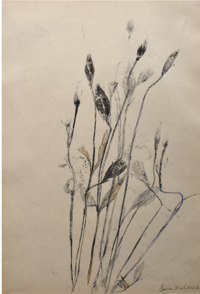
Untitled | 35 x 25 | Mixed Media on Paper