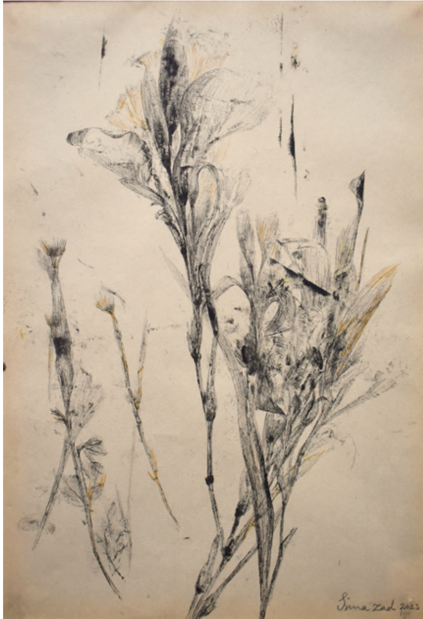
Untitled | 35 x 25 | Mixed Media on Paper