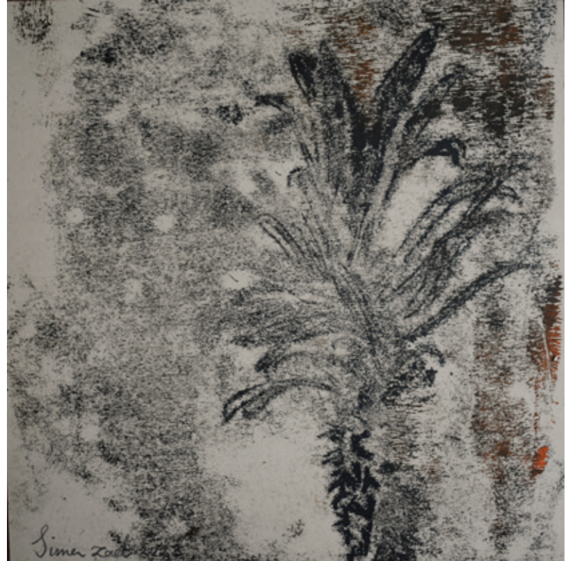
X Untitled | 17 x 17 | Mixed Media on Paper