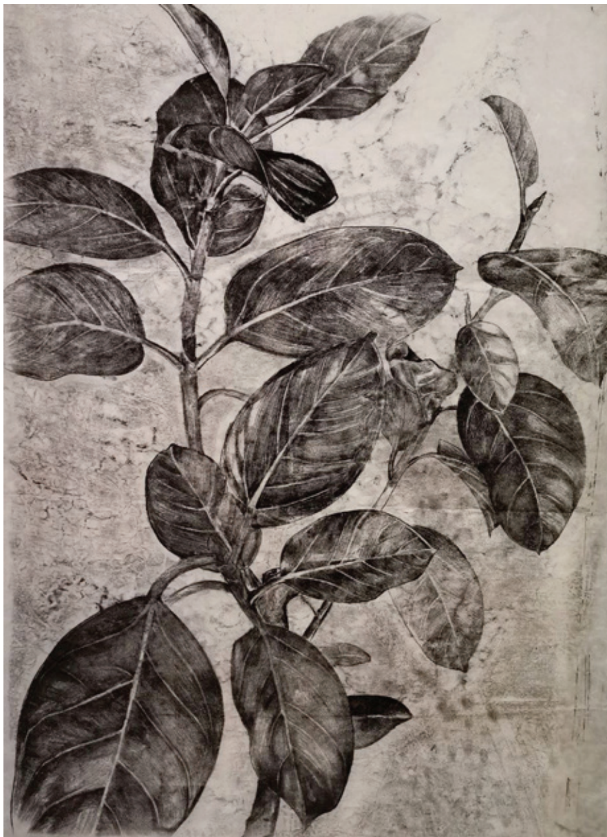
Untitled | 100 x 70 | Mixed Media on Paper