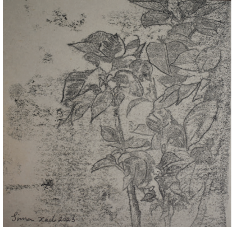
X Untitled | 17 x 17 | Mixed Media on Paper