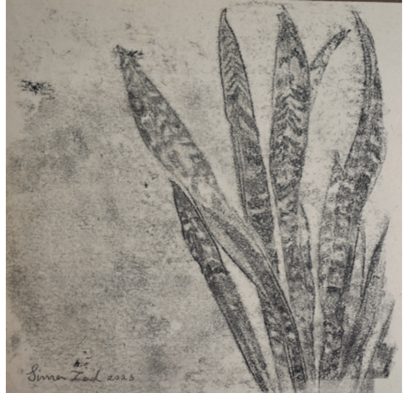
X Untitled | 17 x 17 | Mixed Media on Paper