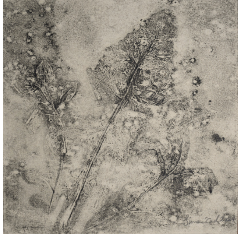
X Untitled | 17 x 17 | Mixed Media on Paper