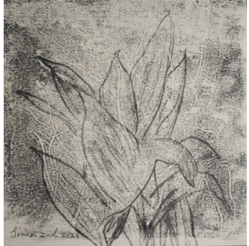
Untitled | 17 x 17 | Mixed Media on Paper