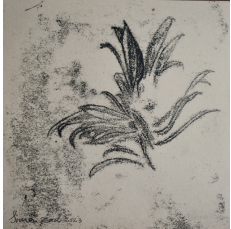
X Untitled | 17 x 17 | Mixed Media on Paper