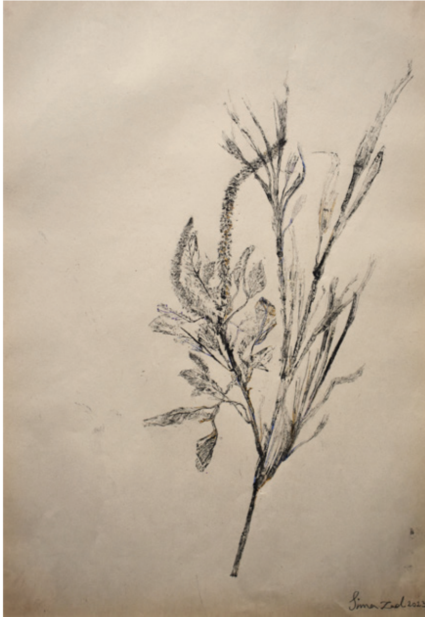
Untitled | 35 x 25 | Mixed Media on Paper