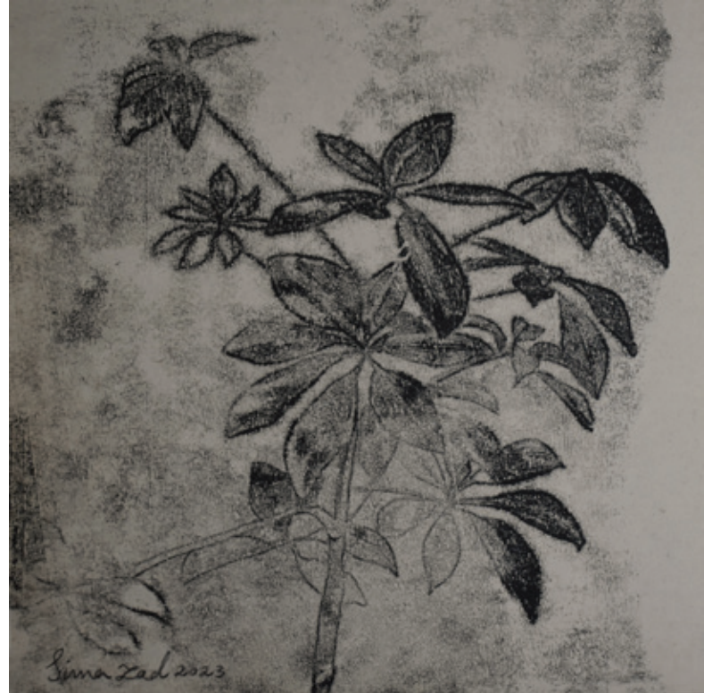
X Untitled | 17 x 17 | Mixed Media on Paper