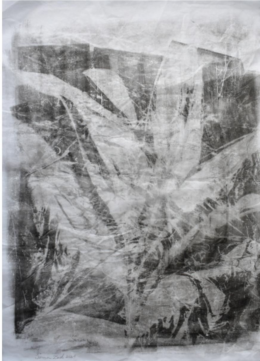
Untitled | 70 x 50 | Mixed Media on Paper