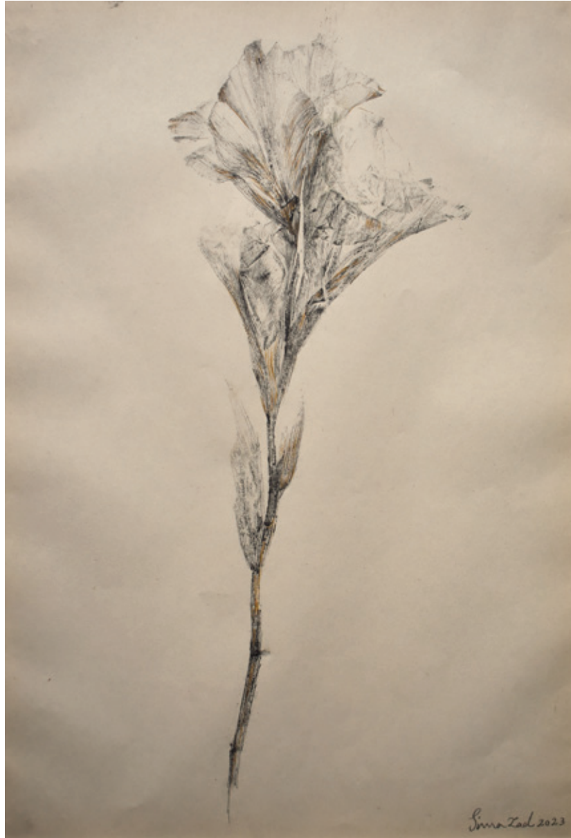
Untitled | 35 x 25 | Mixed Media on Paper