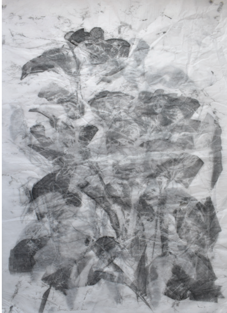
Untitled | 50 x 70 | Mixed Media on Paper