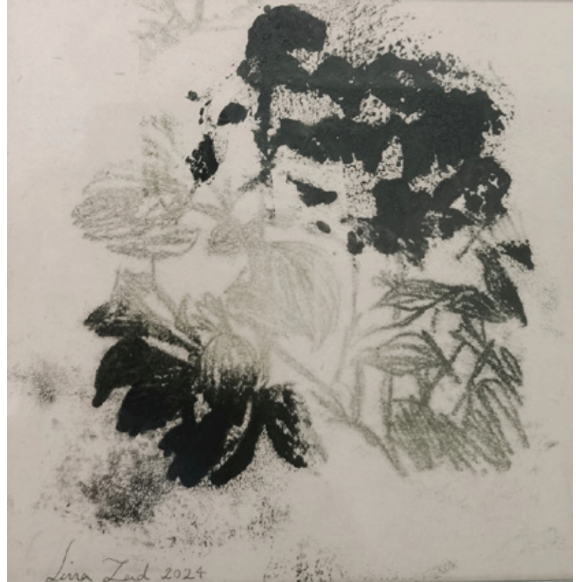
Untitled | 17 x 17 | Mixed Media on Paper