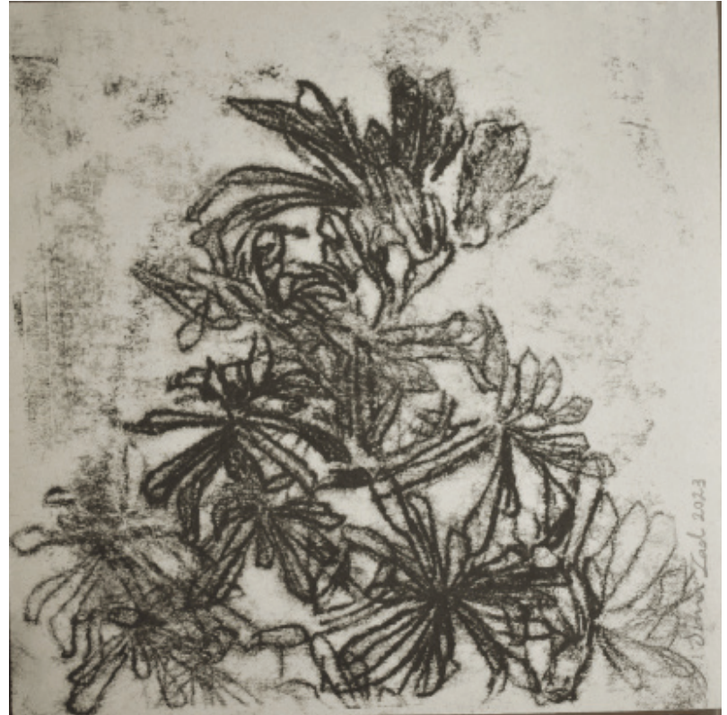
X Untitled | 17 x 17 | Mixed Media on Paper