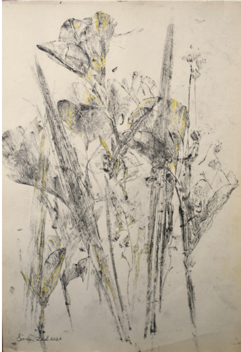
Untitled | 35 x 25 | Mixed Media on Paper