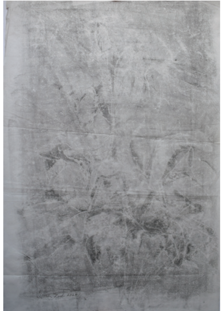
X Untitled | 70 x 50 | Mixed Media on Paper