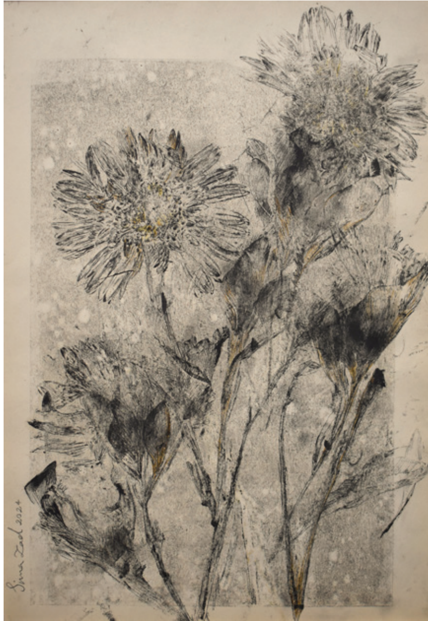
Untitled | 35 x 25 | Mixed Media on Paper