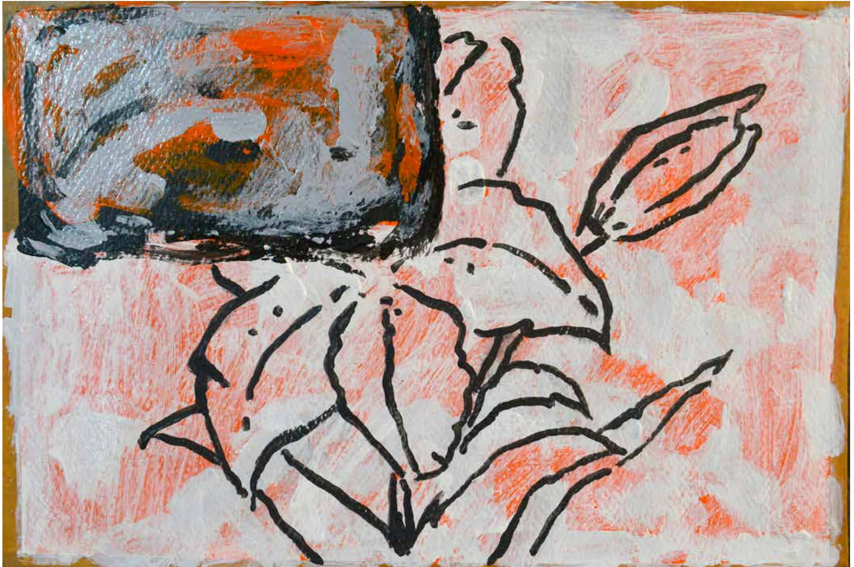
Untitled | 20 x 30 cm | Acrylic on Cardboard