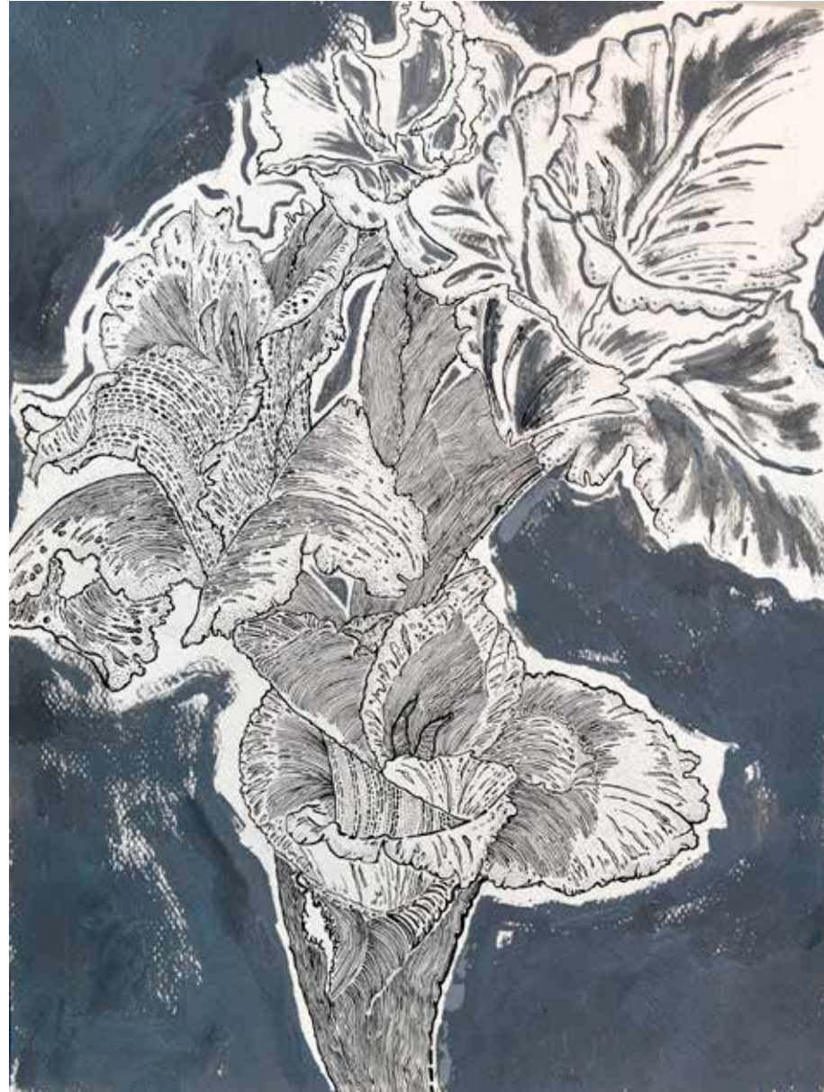
Untitled | 40 x 30 | Acrylic & Ink on Cardboard