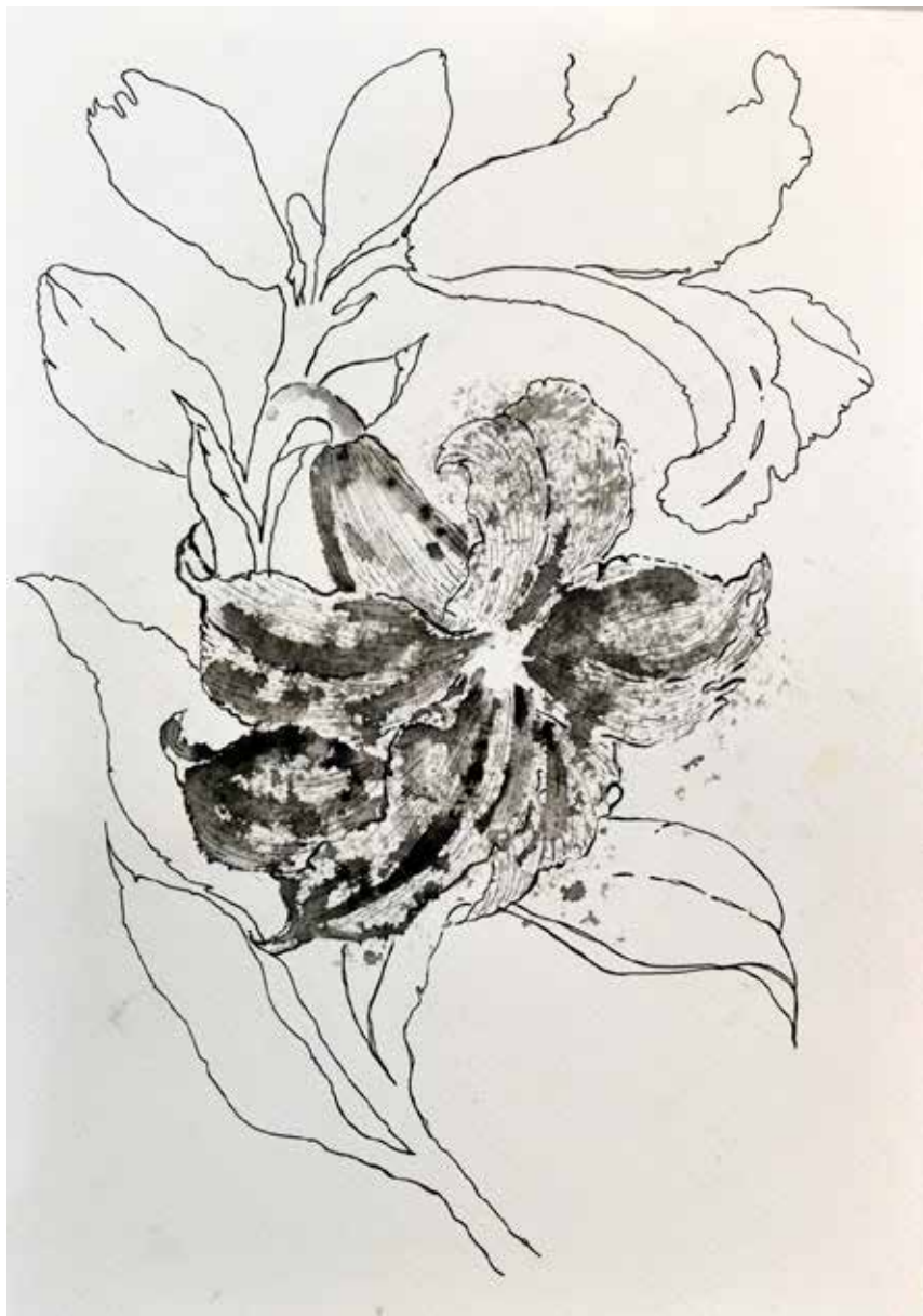
Untitled | 35 x 25 | Ink on Cardboard