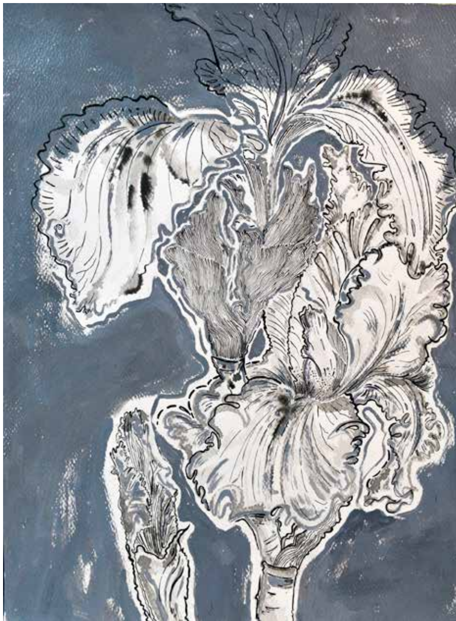
Untitled | 40 x 30 | Acrylic & Ink on Cardboard