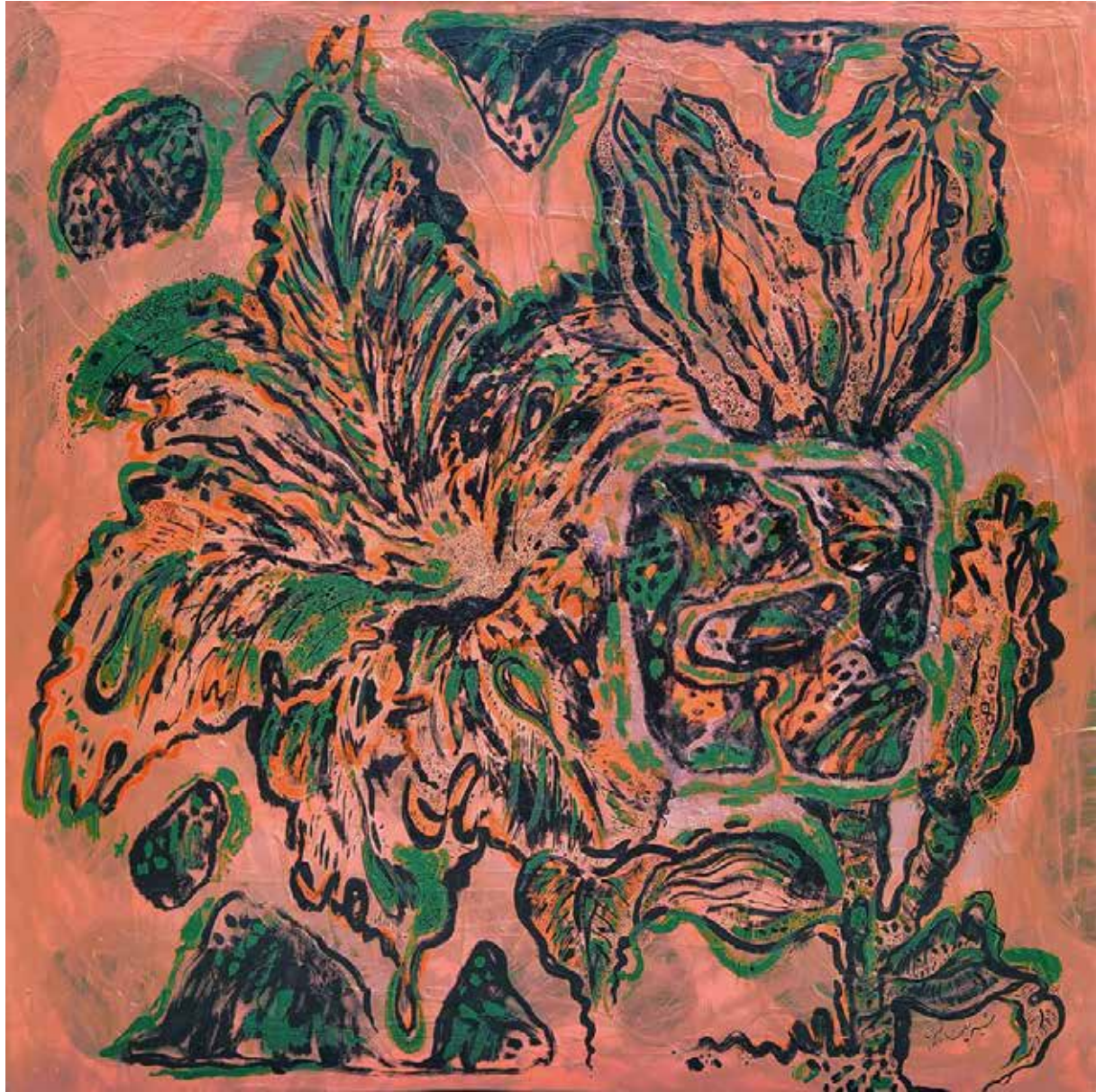
Untitled | 100 x 100 | Acrylic on Canvas