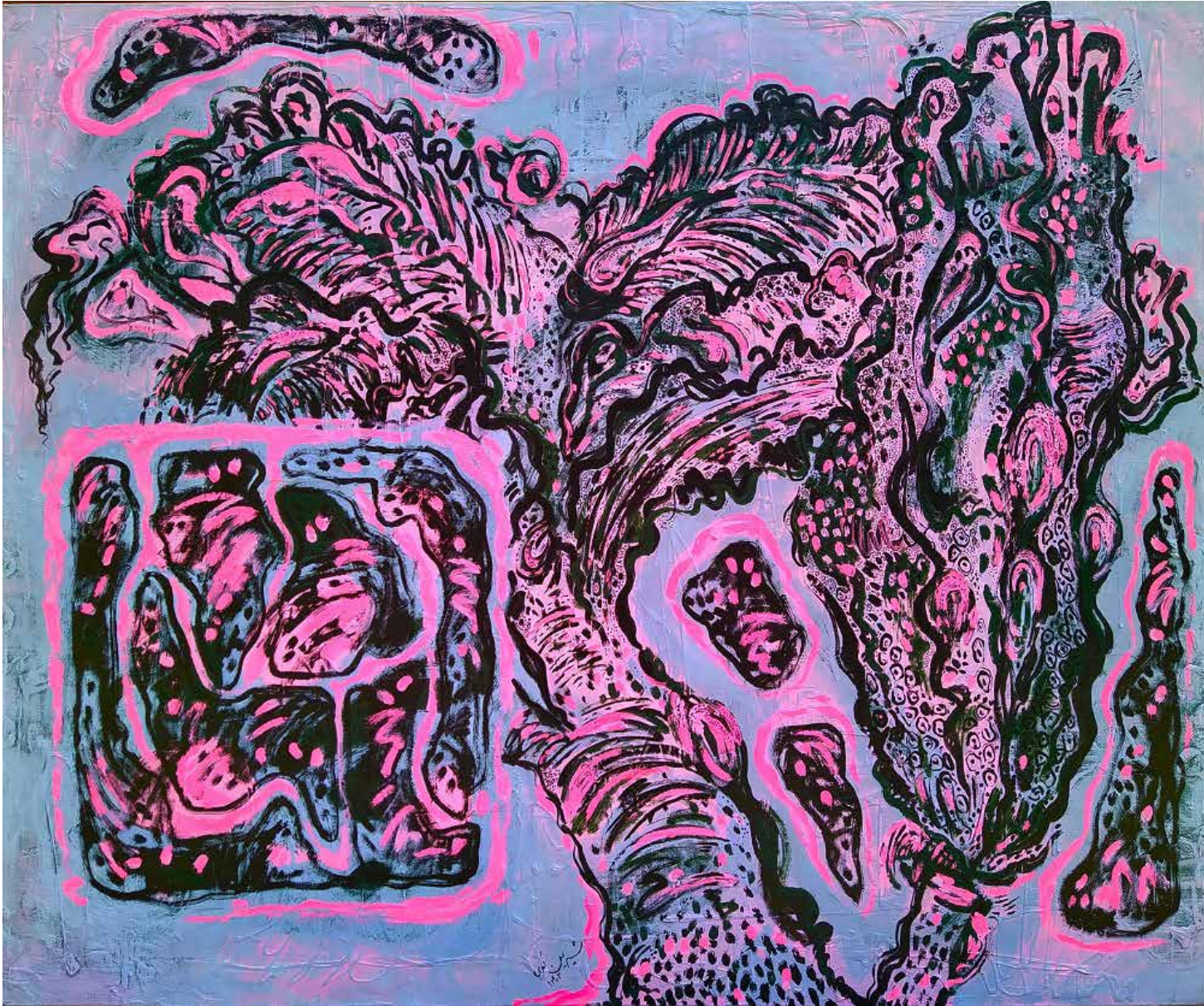
Untitled | 100 x 120 | Acrylic on Canvas