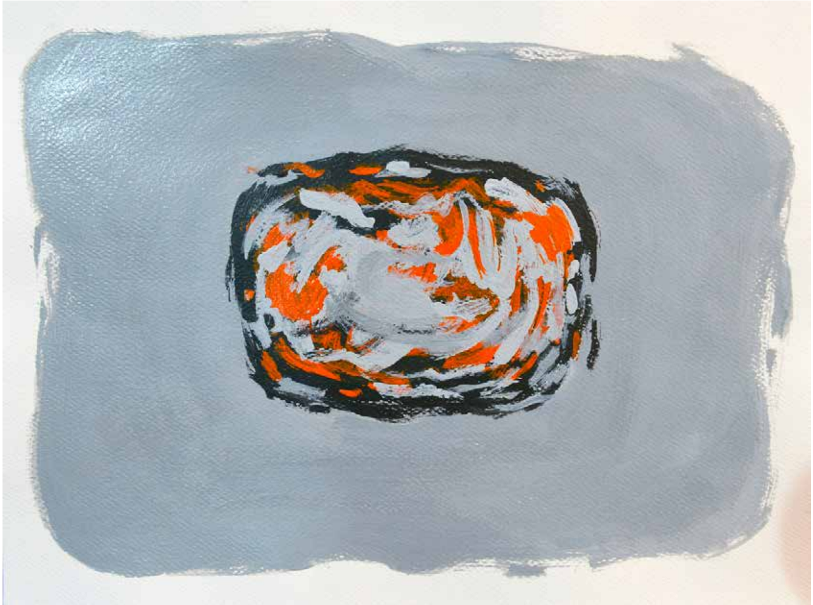
Untitled | 29 x 39 cm | Acrylic on Cardboard