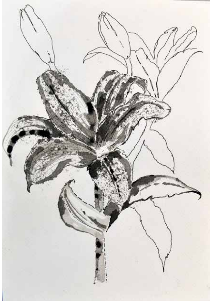
Untitled | 35 x 25 | Ink on Cardboard