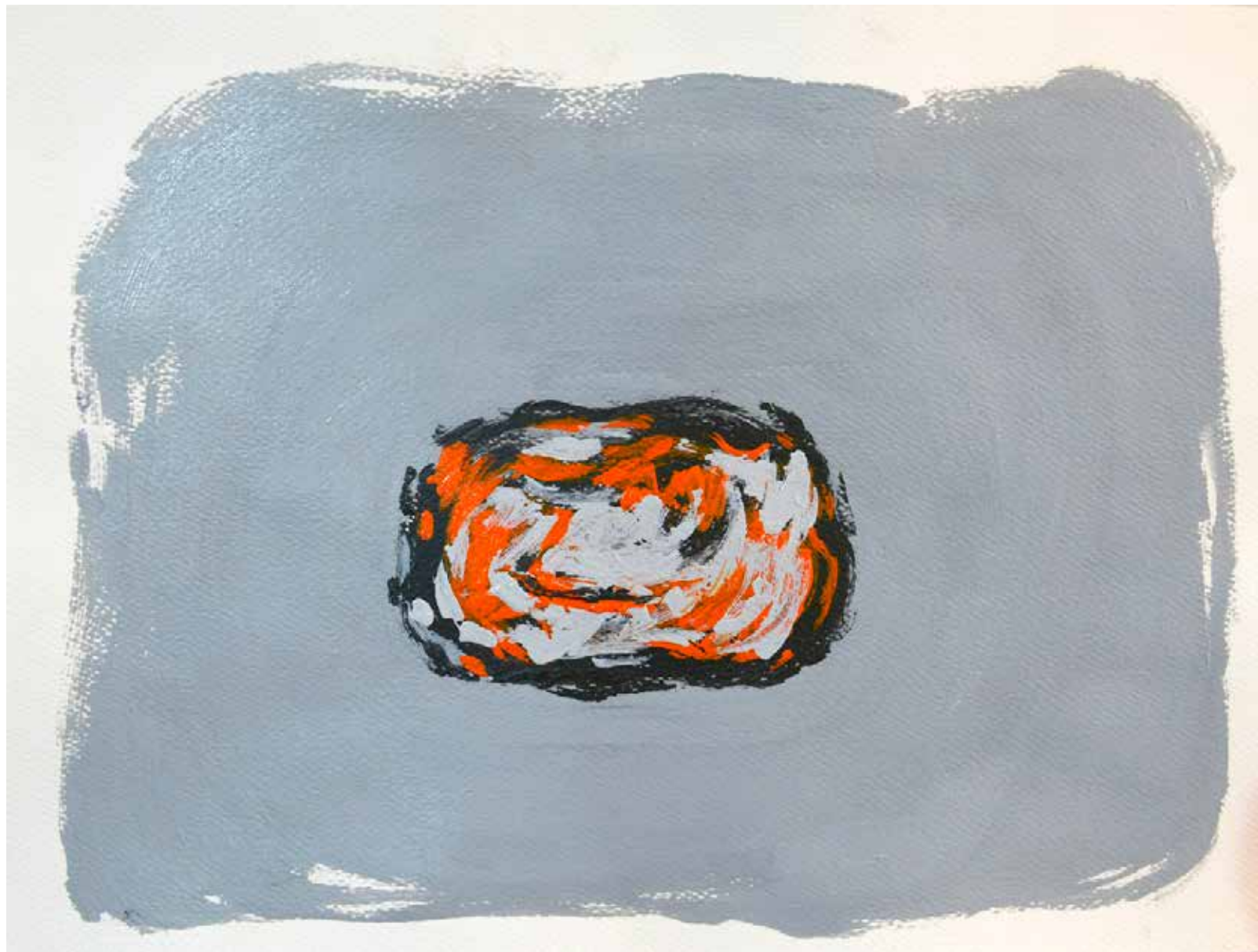
Untitled | 29 x 39 cm | Acrylic on Cardboard