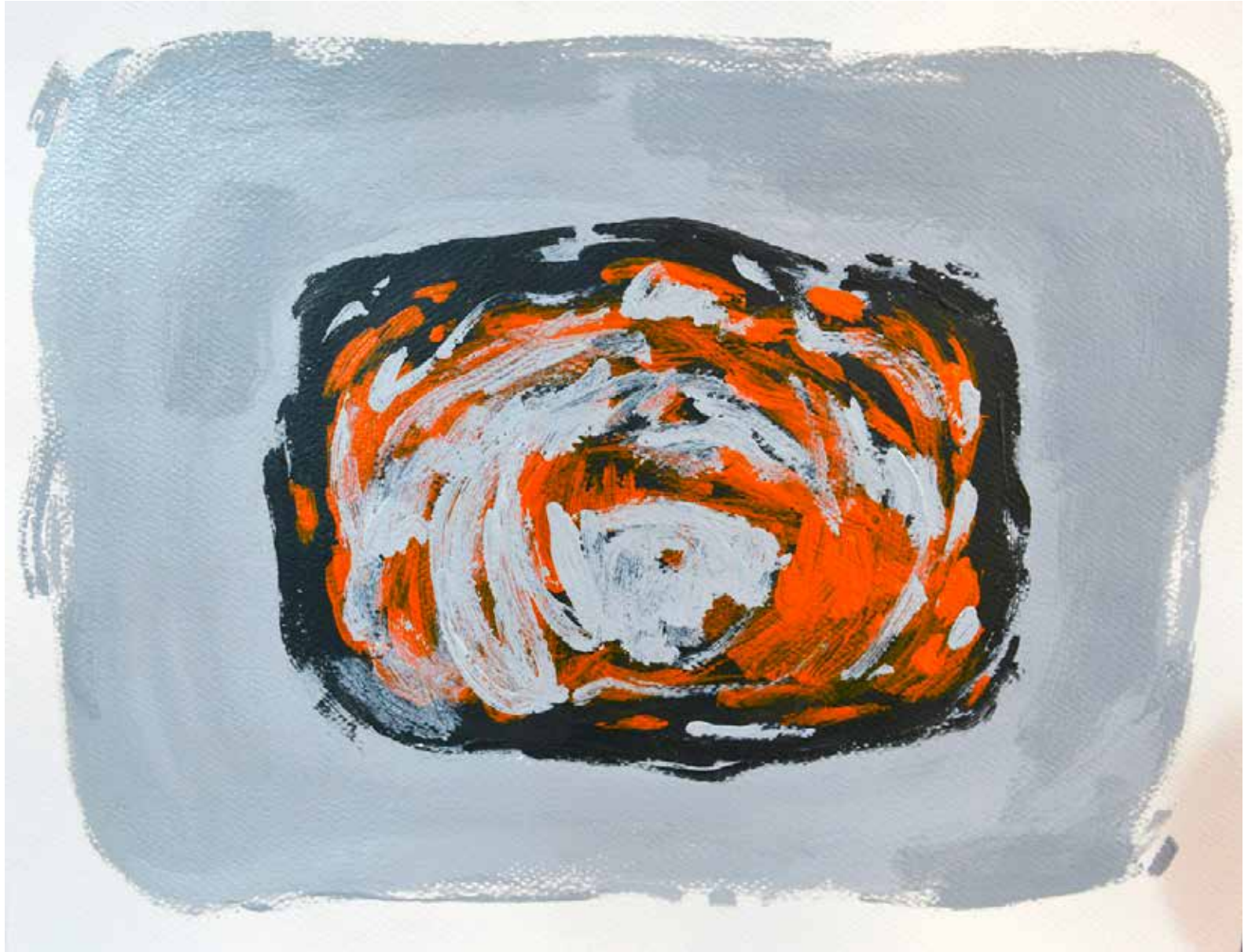
Untitled | 29 x 39 cm | Acrylic on Cardboard