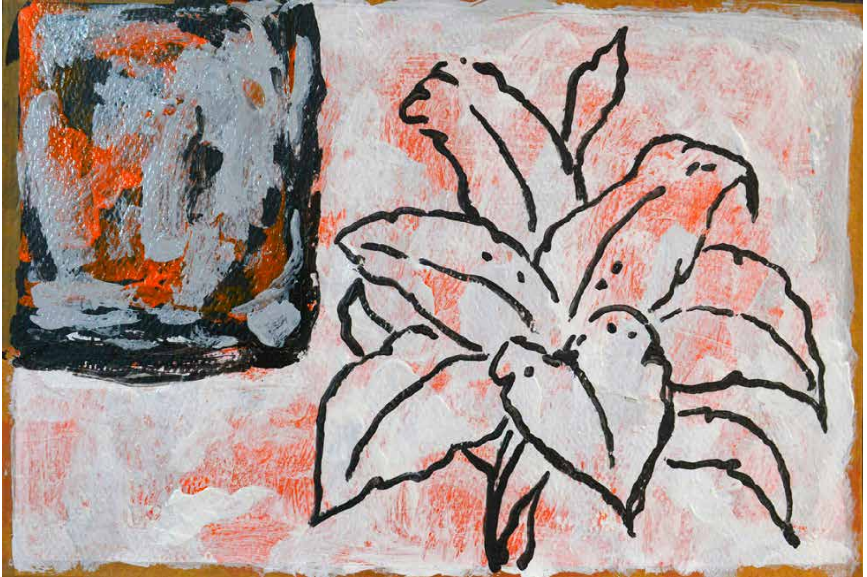
Untitled | 20 x 30 cm | Acrylic on Cardboard