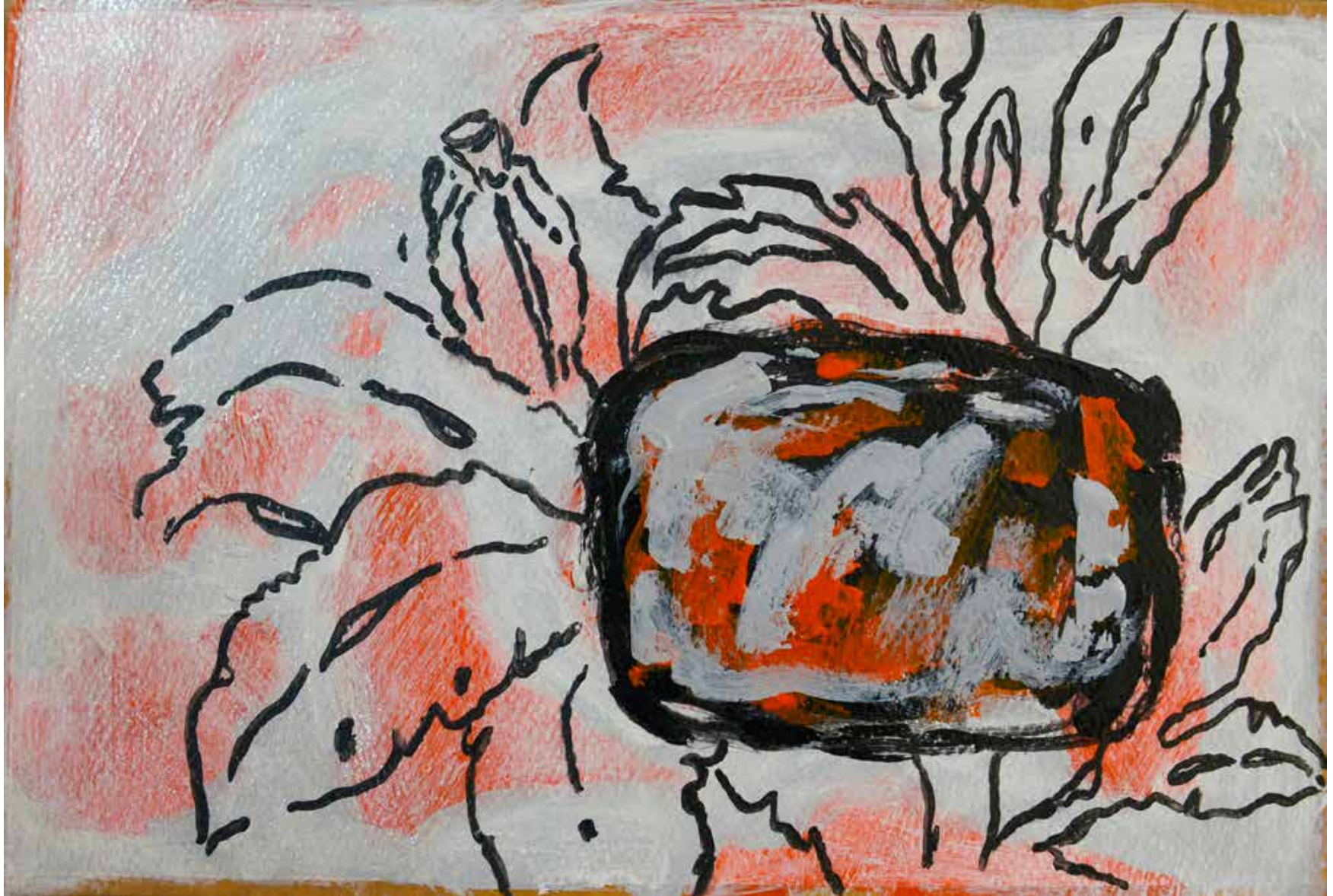
Untitled | 20 x 30 cm | Acrylic on Cardboard