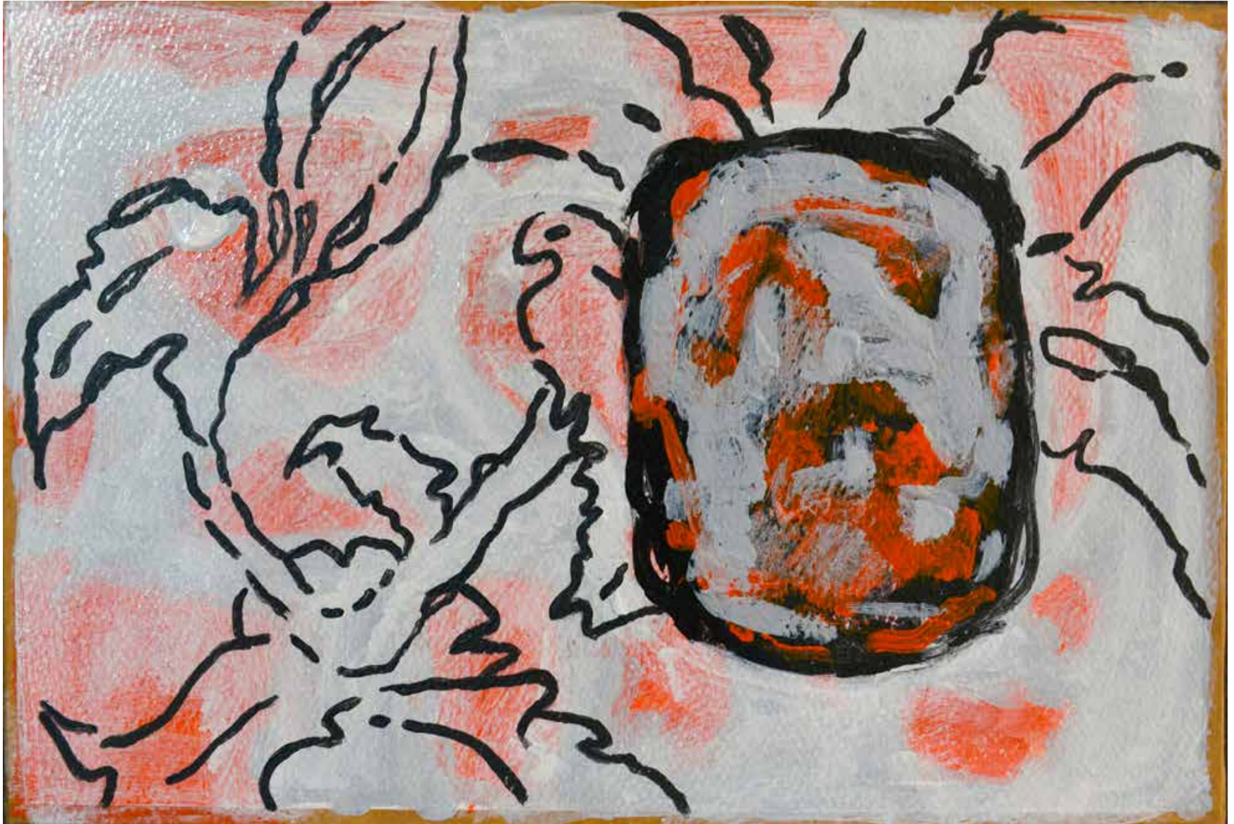
Untitled | 20 x 30 cm | Acrylic on Cardboard