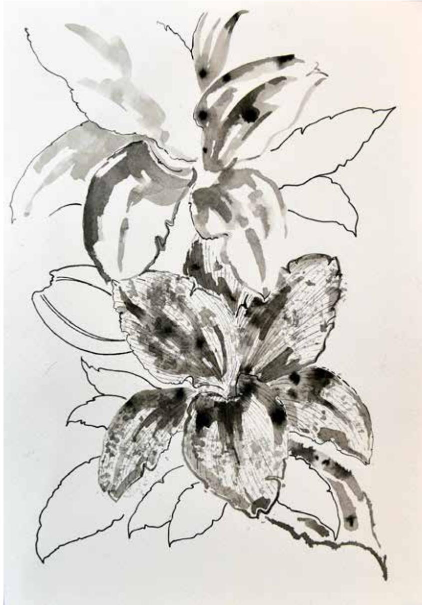
Untitled | 35 x 25 | Ink on Cardboard