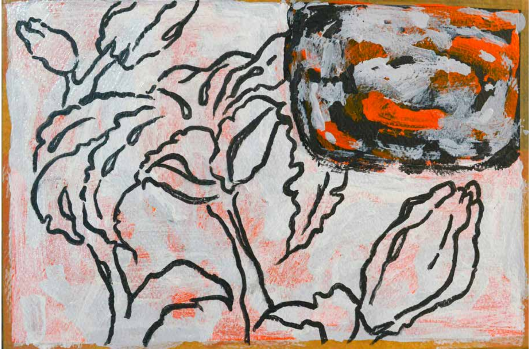
Untitled | 20 x 30 cm | Acrylic on Cardboard