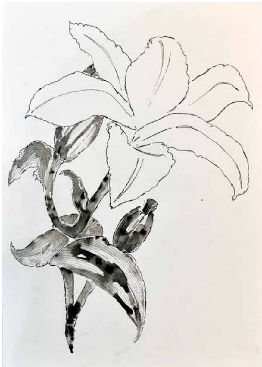
Untitled | 35 x 25 | Ink on Cardboard