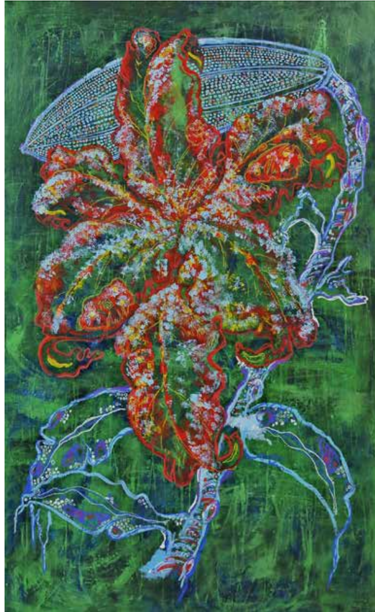
Untitled | 180 x 110 | Acrylic on Canvas