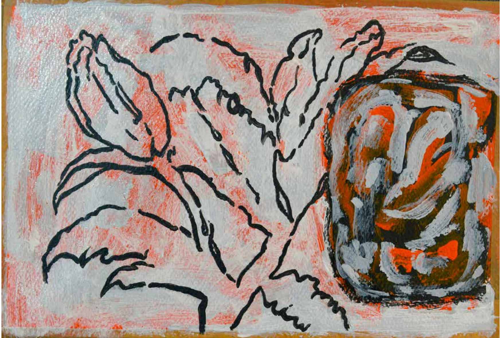
Untitled | 20 x 30 cm | Acrylic on Cardboard