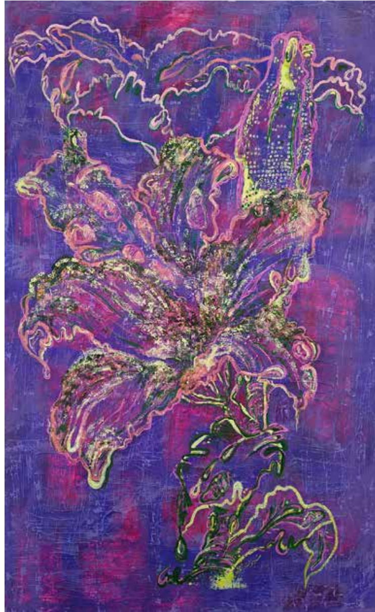
Untitled | 180 x 110 | Acrylic on Canvas