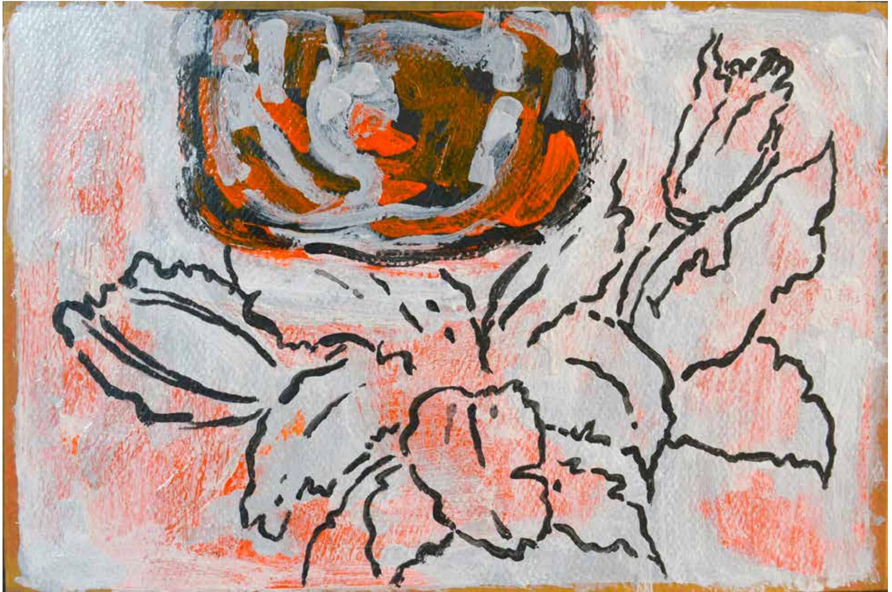
Untitled | 20 x 30 cm | Acrylic on Cardboard