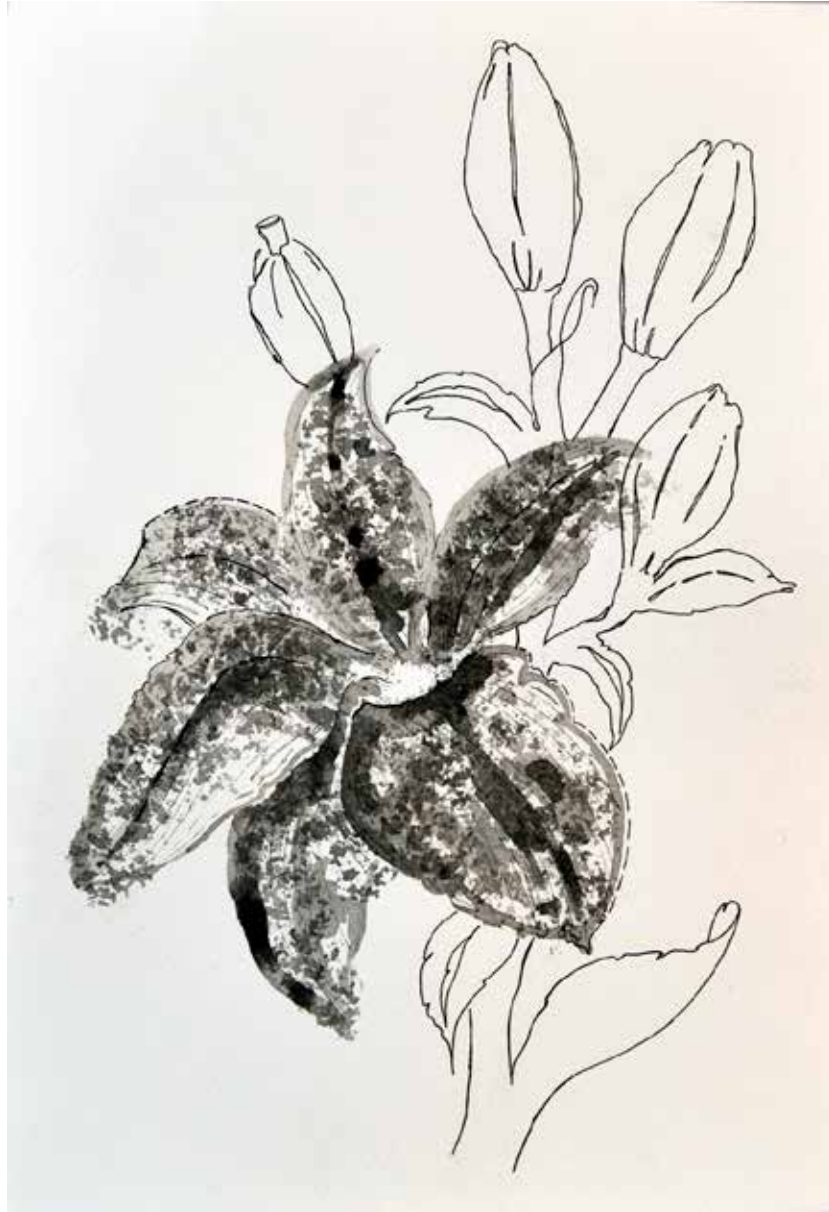
Untitled | 35 x 25 | Ink on Cardboard