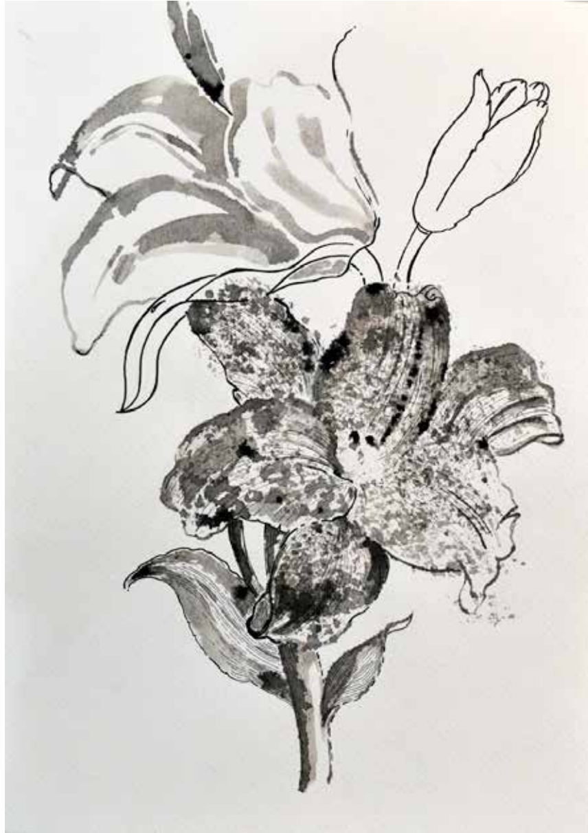
Untitled | 35 x 25 | Ink on Cardboard