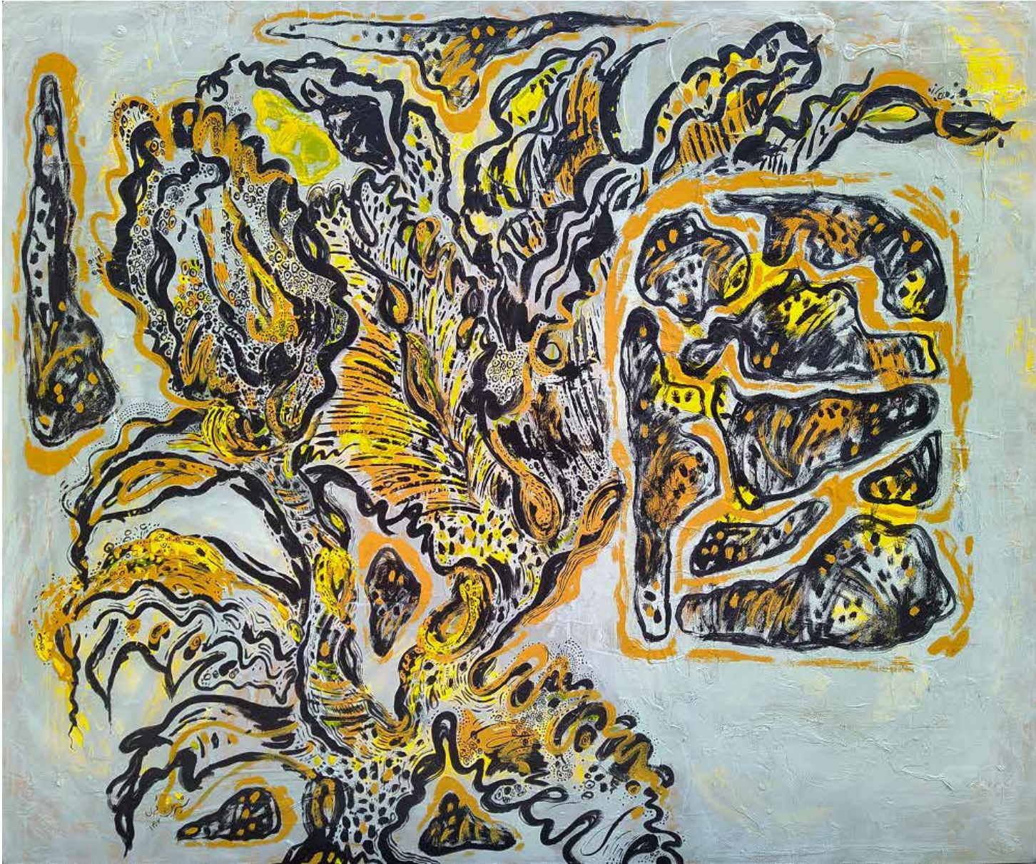
Untitled | 100 x 120 | Acrylic on Canvas