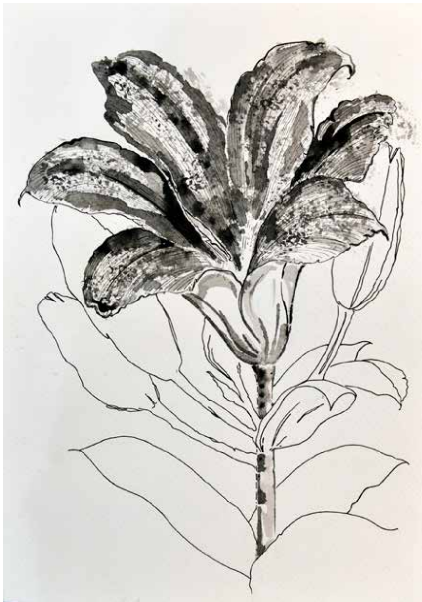
Untitled | 35 x 25 | Ink on Cardboard