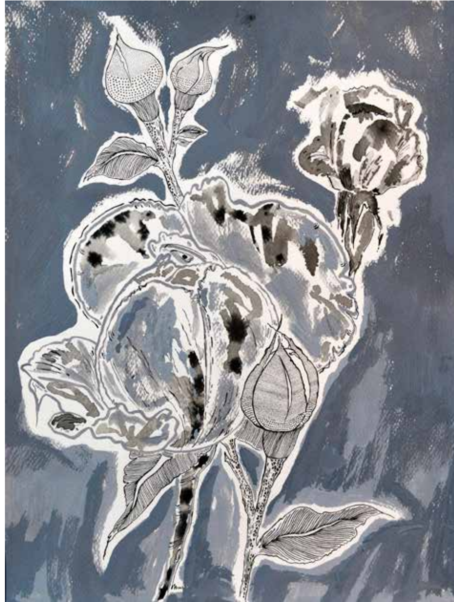
Untitled | 40 x 30 | Acrylic & Ink on Cardboard