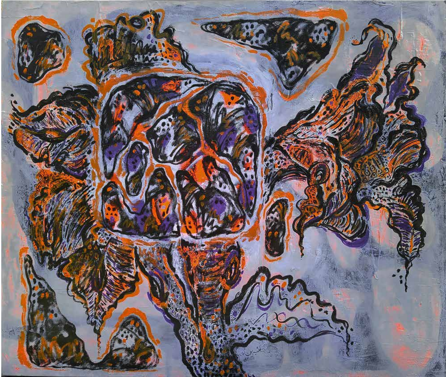
On the verge of becoming | 100 x 120 | Acrylic on Canvas