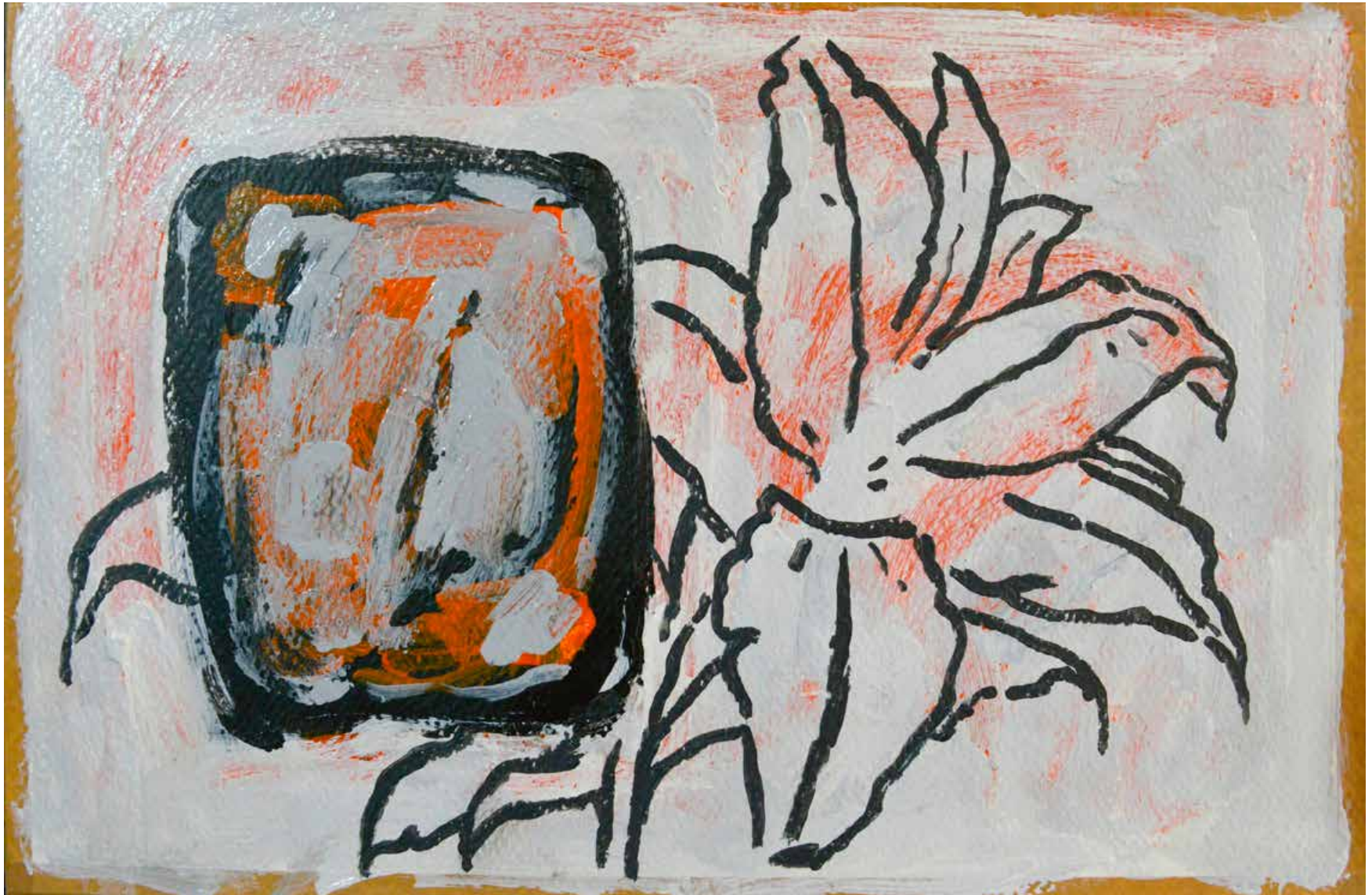
Untitled | 20 x 30 cm | Acrylic on Cardboard