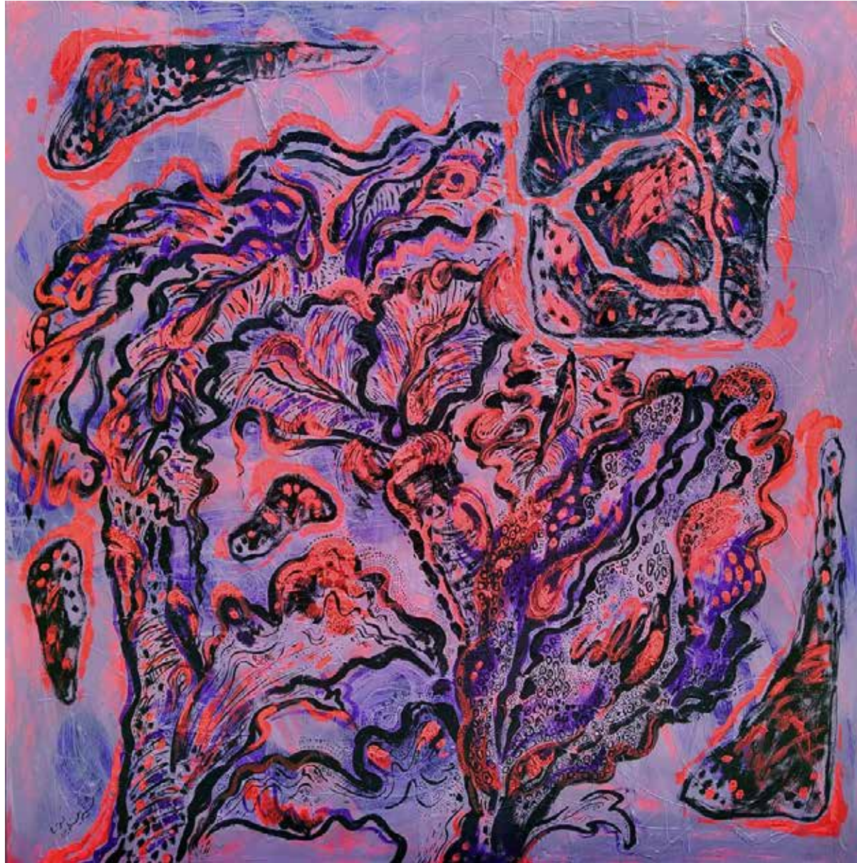
Untitled | 100 x 100 | Acrylic on Canvas