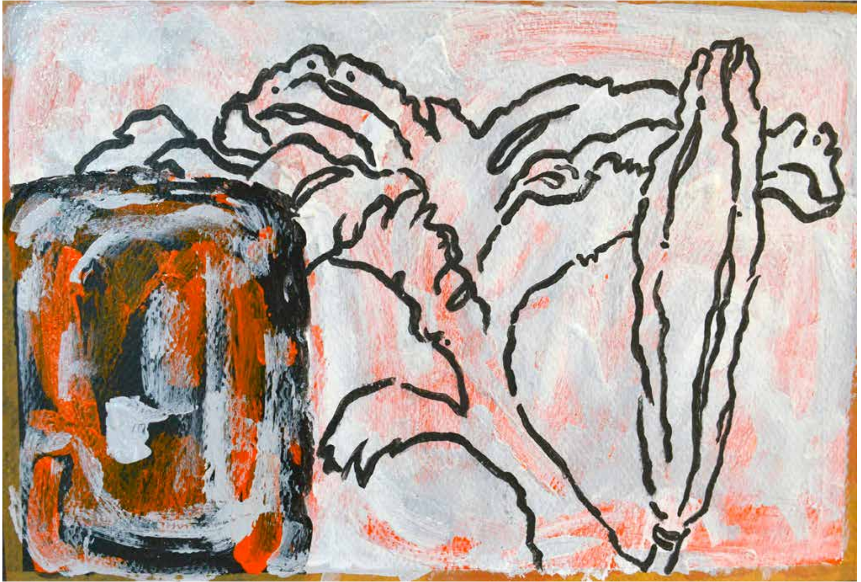
Untitled | 20 x 30 cm | Acrylic on Cardboard