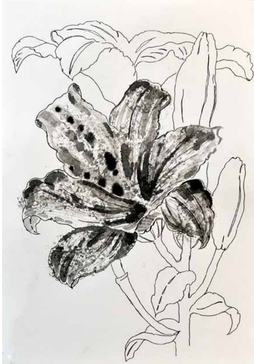
Untitled | 35 x 25 | Ink on Cardboard