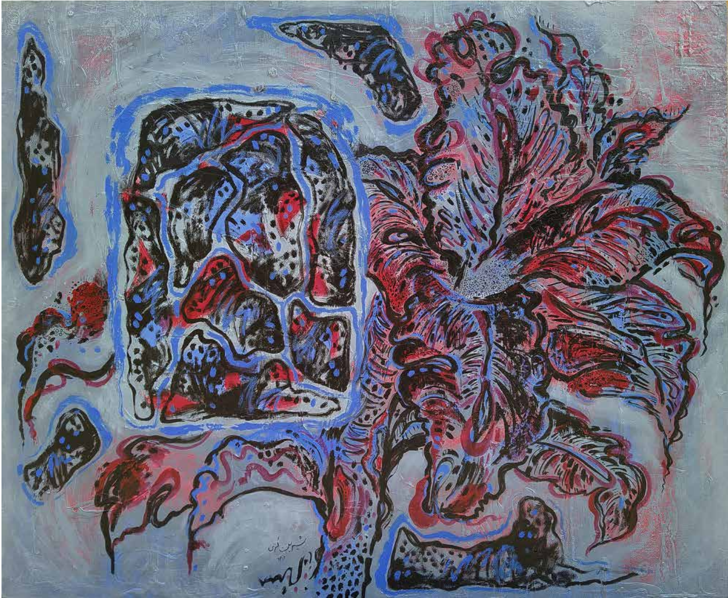
Untitled | 100 x 120 | Acrylic on Canvas