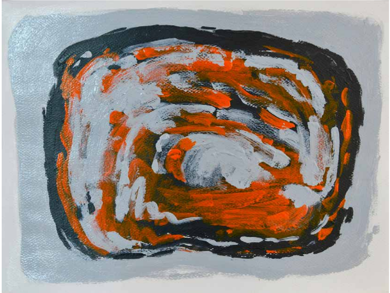
Untitled | 29 x 39 cm | Acrylic on Cardboard