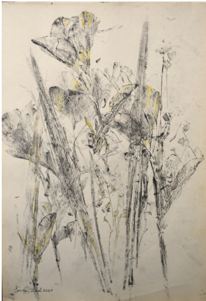
Untitled | 35 x 25 | Mixed Media on Paper | 3.500.000 Toman