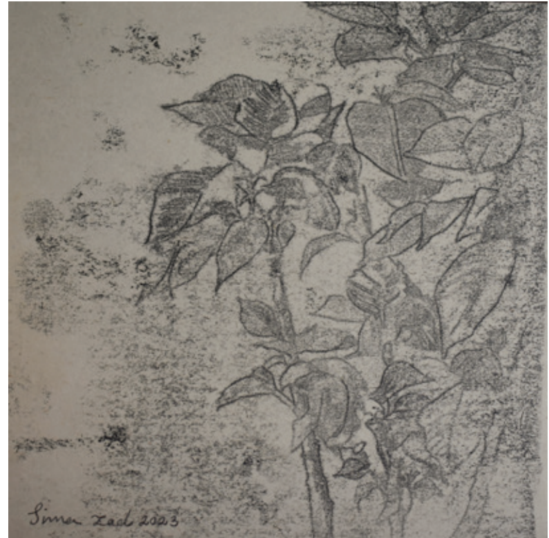
X Untitled | 17 x 17 | Mixed Media on Paper | 2.500.000 Toman