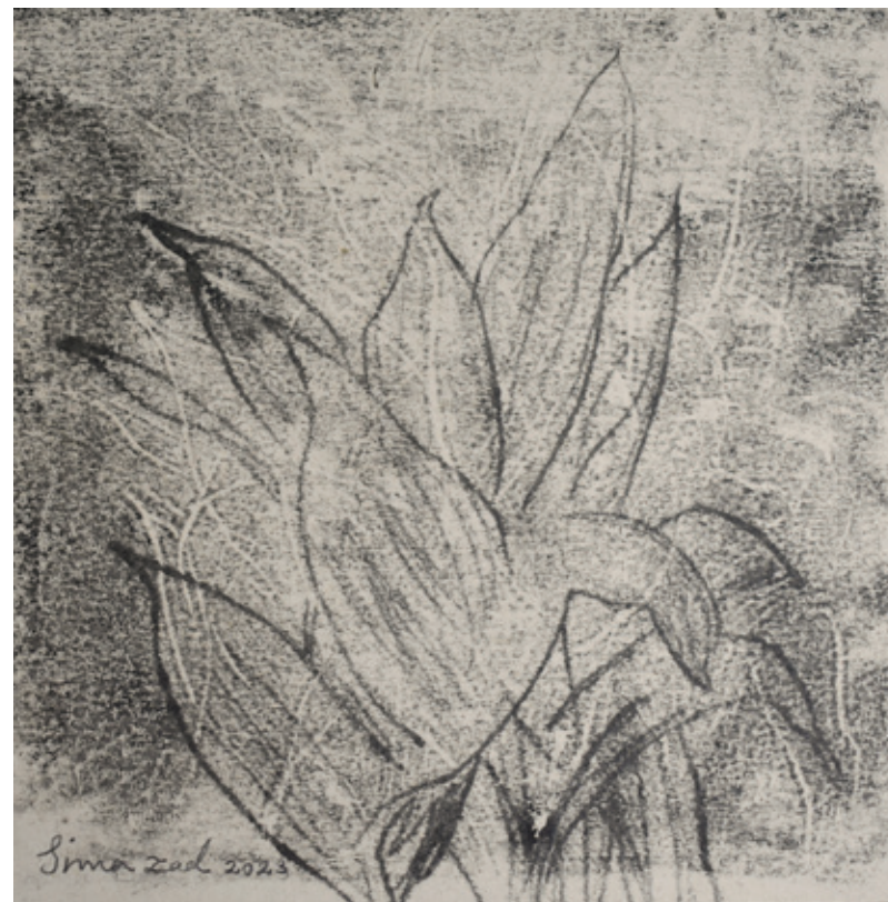
Untitled | 17 x 17 | Mixed Media on Paper | 2.500.000 Toman