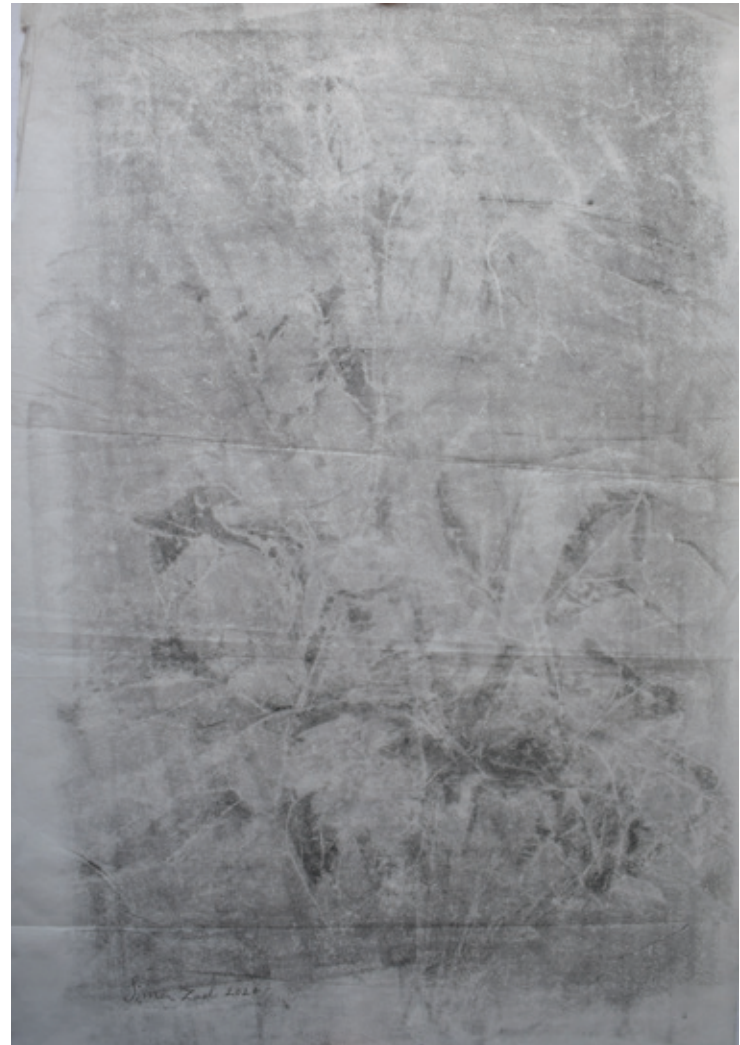
X Untitled | 70 x 50 | Mixed Media on Paper | 4.500.000 Toman