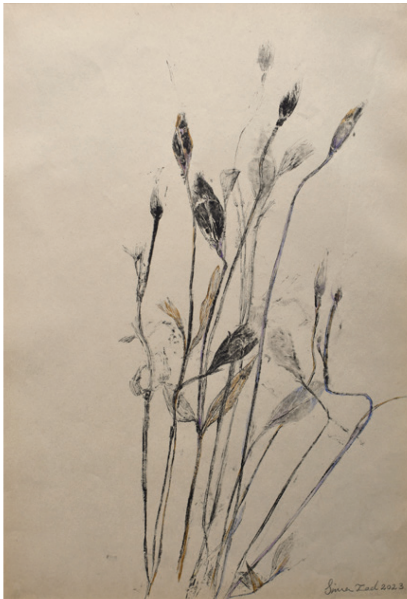
Untitled | 35 x 25 | Mixed Media on Paper | 3.500.000 Toman