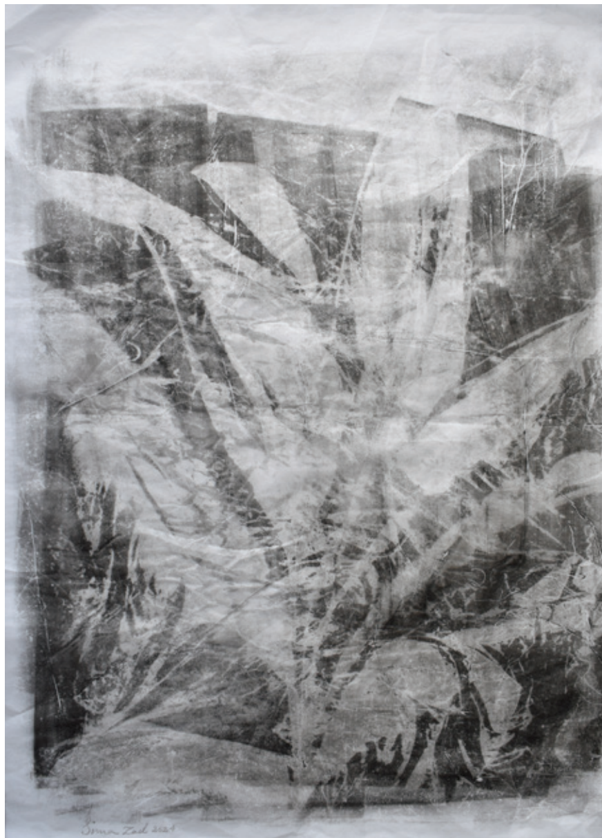
Untitled | 70 x 50 | Mixed Media on Paper | 4.500.000 Toman