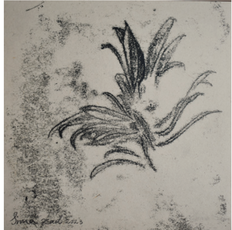
X Untitled | 17 x 17 | Mixed Media on Paper | 2.500.000 Toman