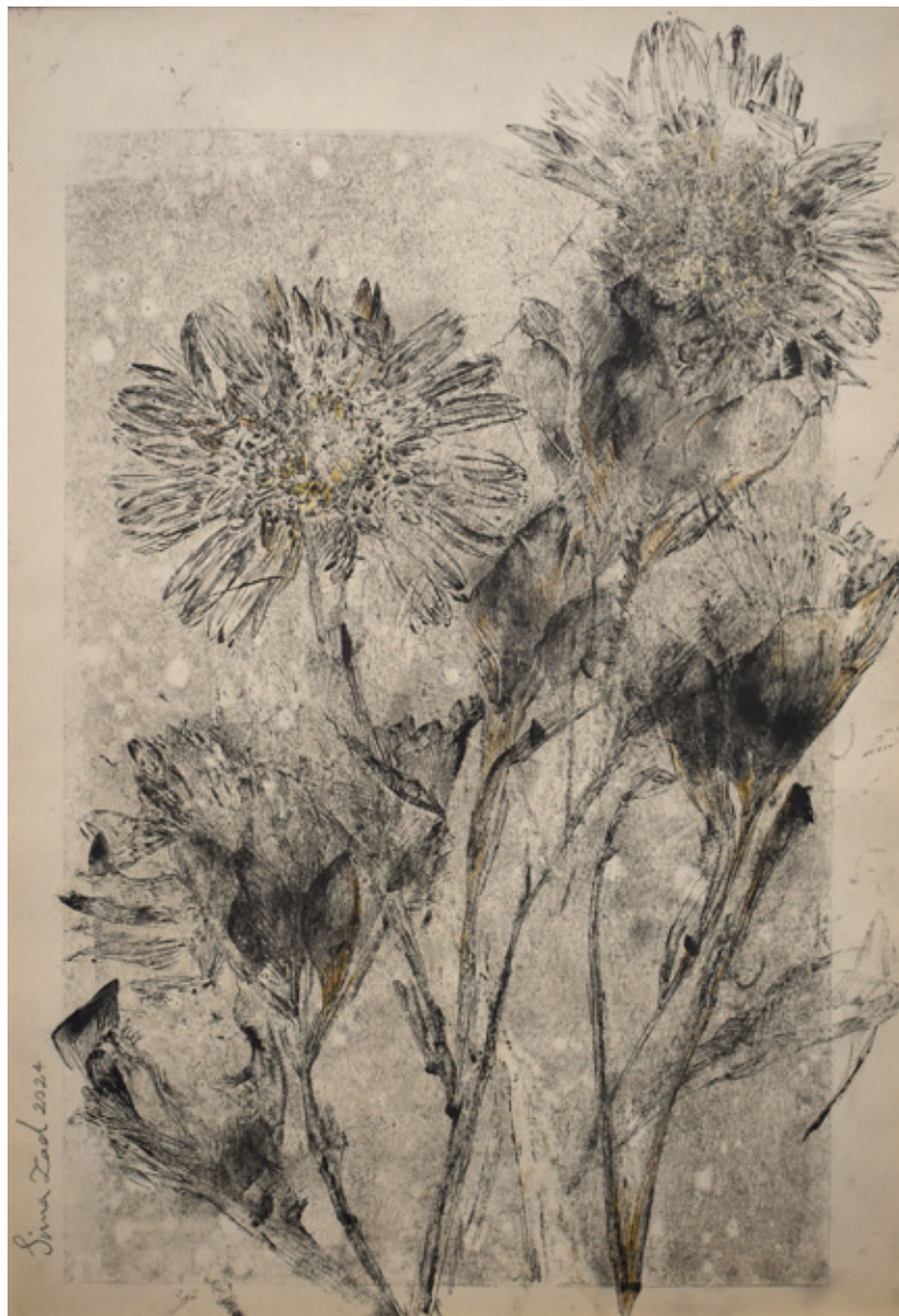
Untitled | 35 x 25 | Mixed Media on Paper | 3.500.000 Toman