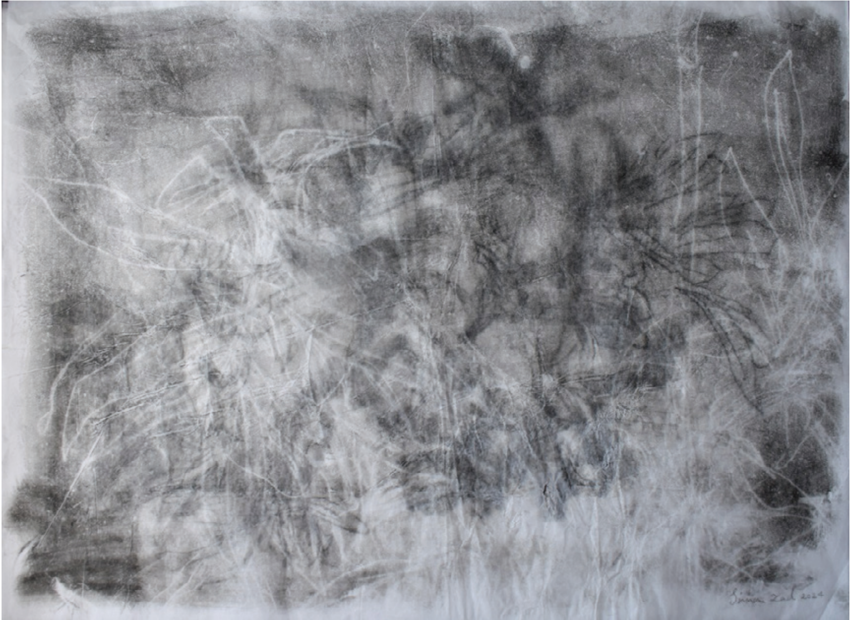
Untitled | 50 x 70 | Mixed Media on Paper | 4.500.000 Toman