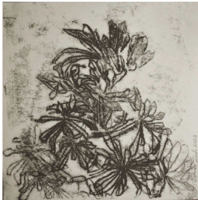
X Untitled | 17 x 17 | Mixed Media on Paper | 2.500.000 Toman