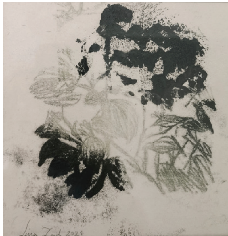
Untitled | 17 x 17 | Mixed Media on Paper | 2.500.000 Toman