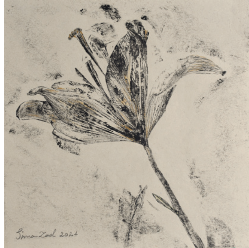
X Untitled | 17 x 17 | Mixed Media on Paper | 2.500.000 Toman