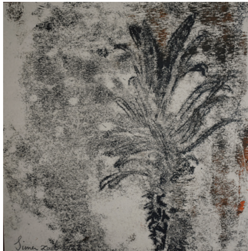
X Untitled | 17 x 17 | Mixed Media on Paper | 2.500.000 Toman