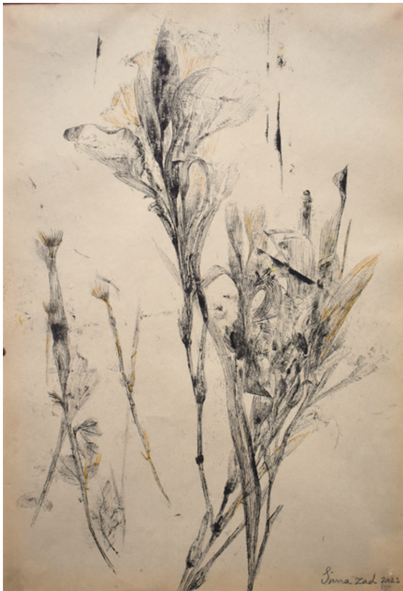
Untitled | 35 x 25 | Mixed Media on Paper | 3.500.000 Toman