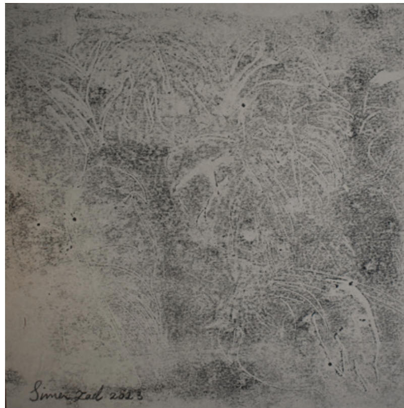
X Untitled | 17 x 17 | Mixed Media on Paper | 2.500.000 Toman