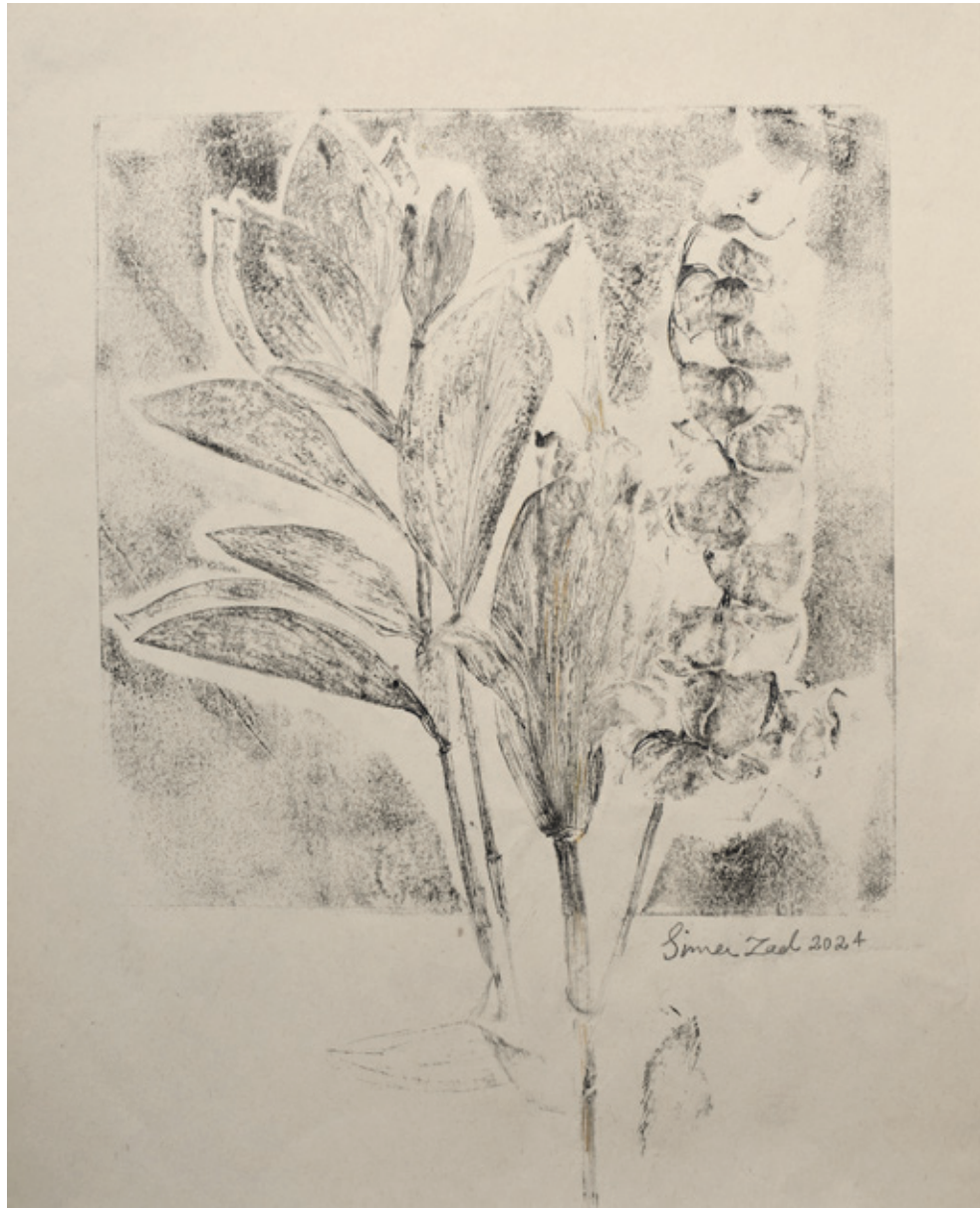
Untitled | 22 x 26 | Mixed Media on Paper | 3.000.000 Toman