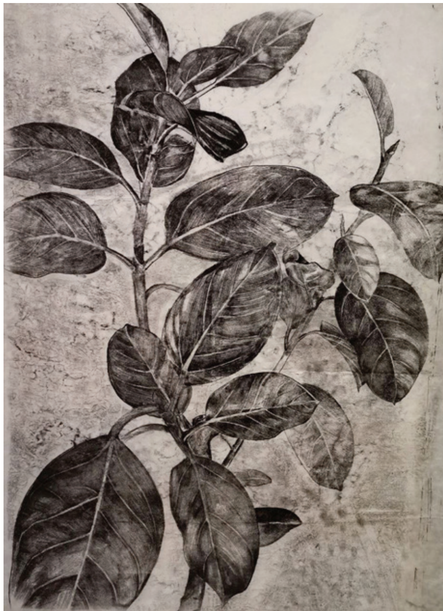
Untitled | 100 x 70 | Mixed Media on Paper | 7.000.000 Toman