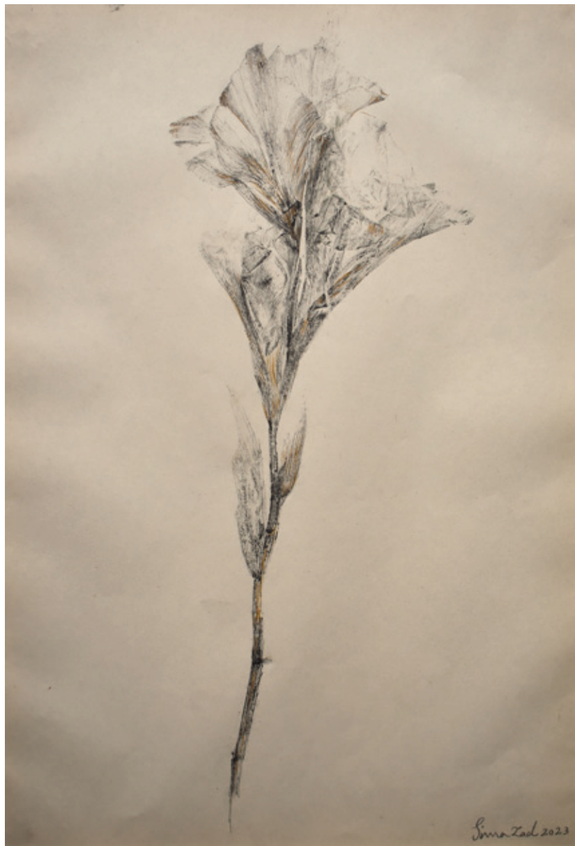
Untitled | 35 x 25 | Mixed Media on Paper | 3.500.000 Toman