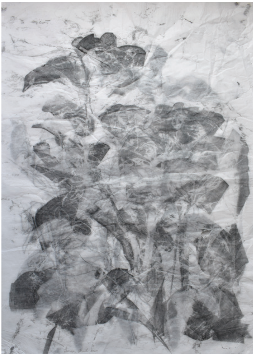
Untitled | 50 x 70 | Mixed Media on Paper | 4.500.000 Toman