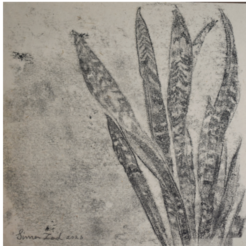
X Untitled | 17 x 17 | Mixed Media on Paper | 2.500.000 Toman