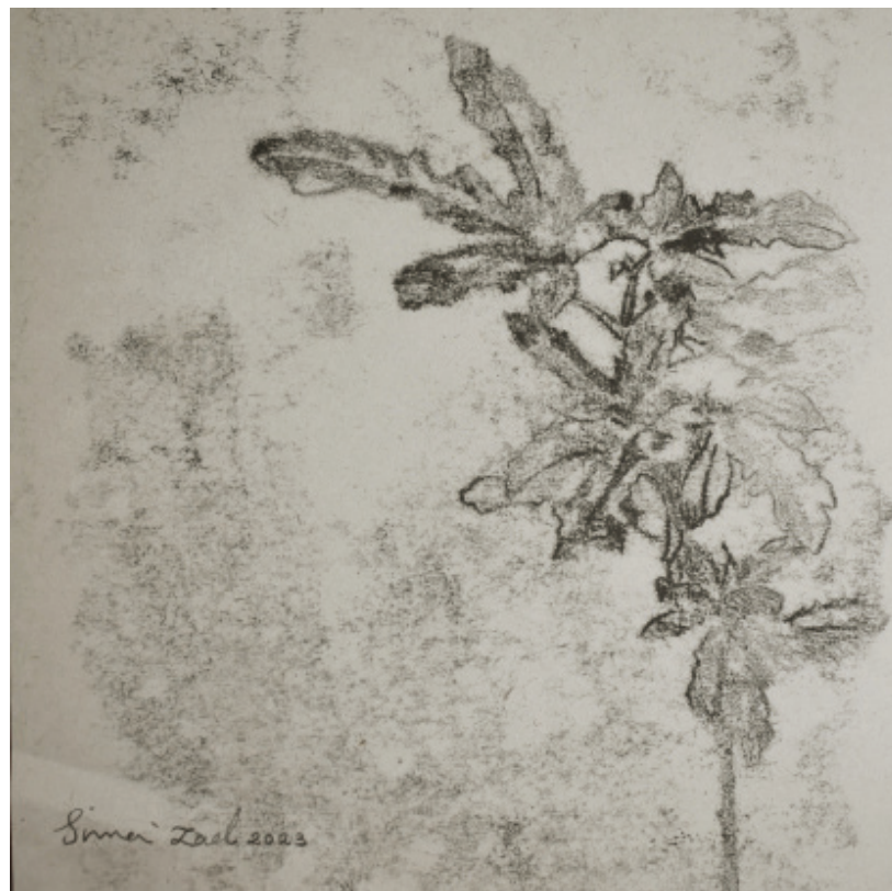
X Untitled | 17 x 17 | Mixed Media on Paper | 2.500.000 Toman