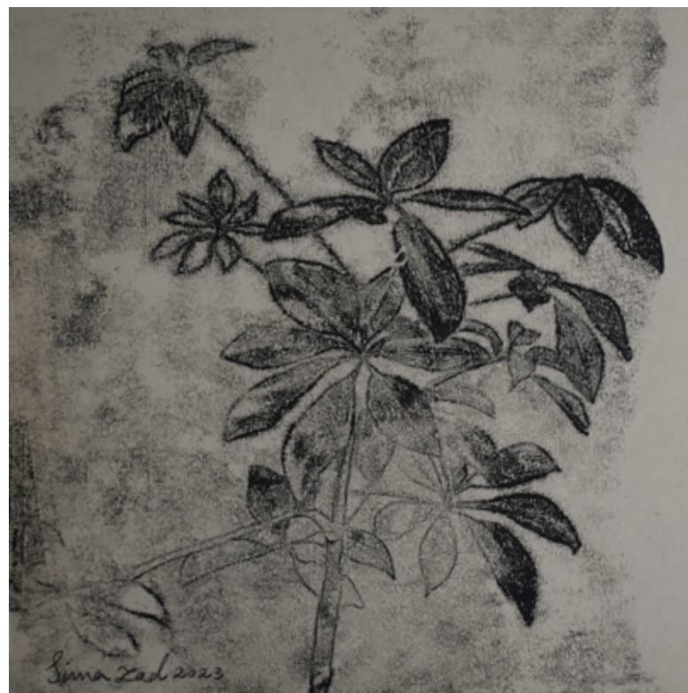
X Untitled | 17 x 17 | Mixed Media on Paper | 2.500.000 Toman