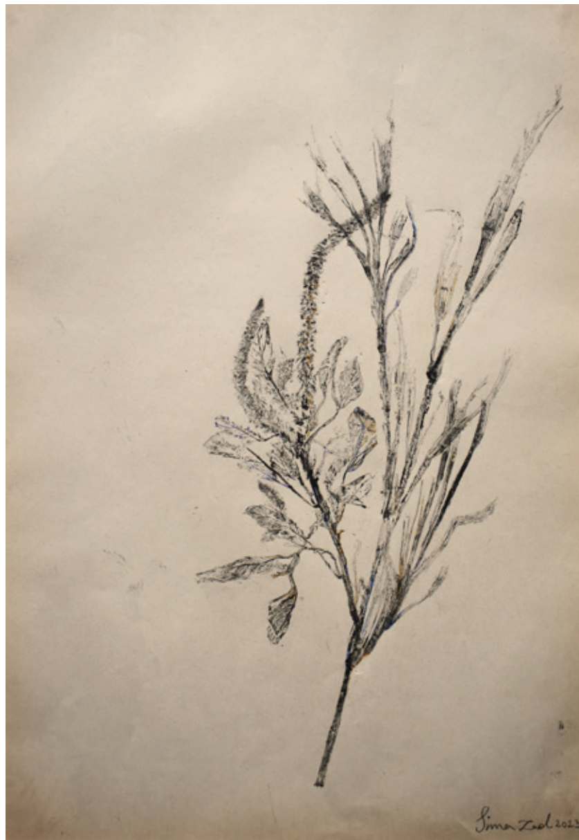
Untitled | 35 x 25 | Mixed Media on Paper | 3.500.000 Toman