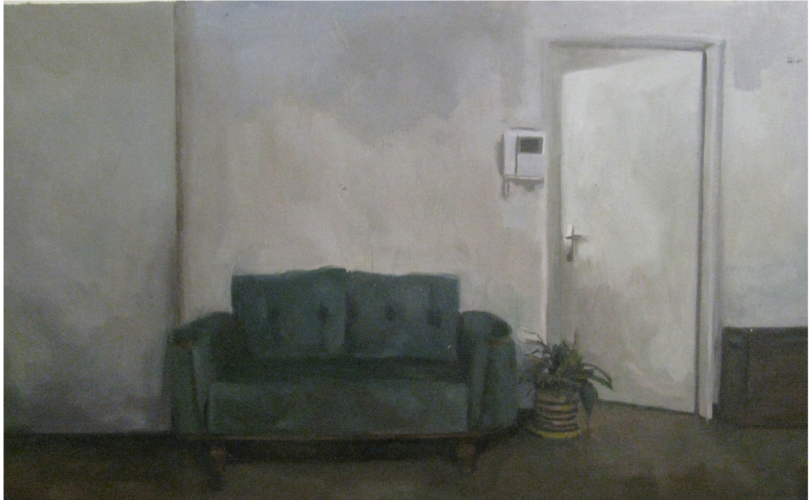
Untitled | Oil on Cardboard | 28 x 45 cm