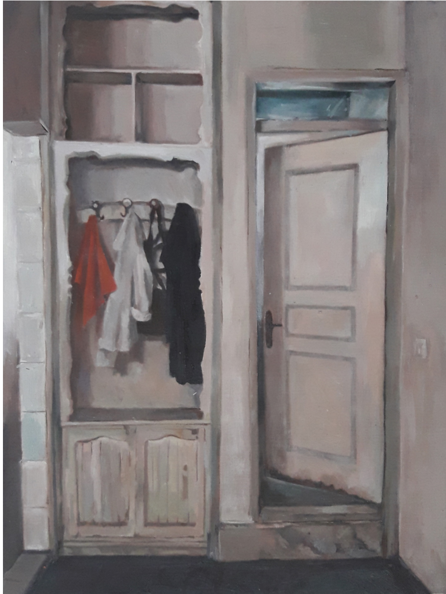
Untitled | Oil on Cardboard | 40 x 30 cm