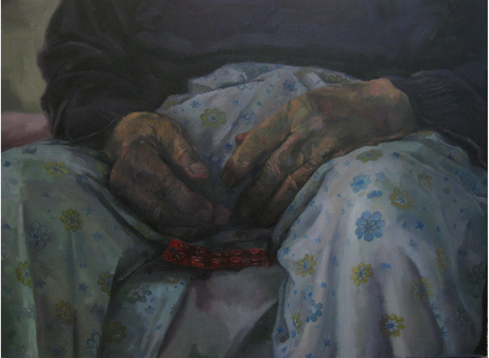
Untitled | Oil on Canvas | 80 x 100 cm