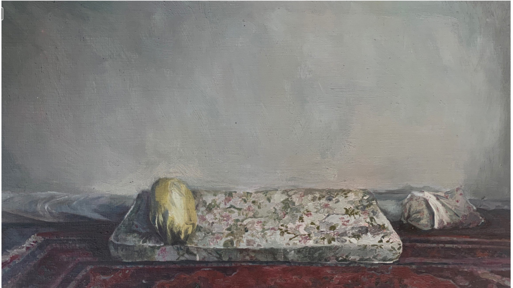
Untitled | Oil on Cardboard | 26 x 46 cm