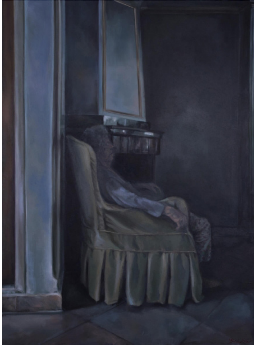
Untitled | Oil on Canvas | 110 x 90 cm