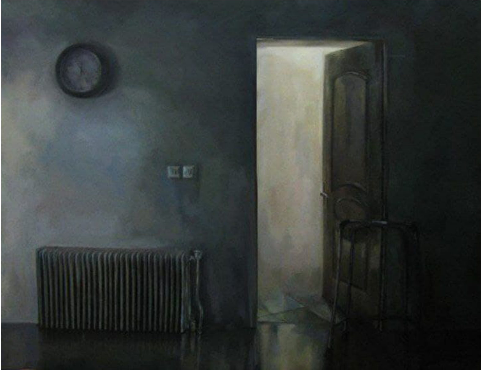
Untitled | Oil on Canvas | 100 x 130 cm