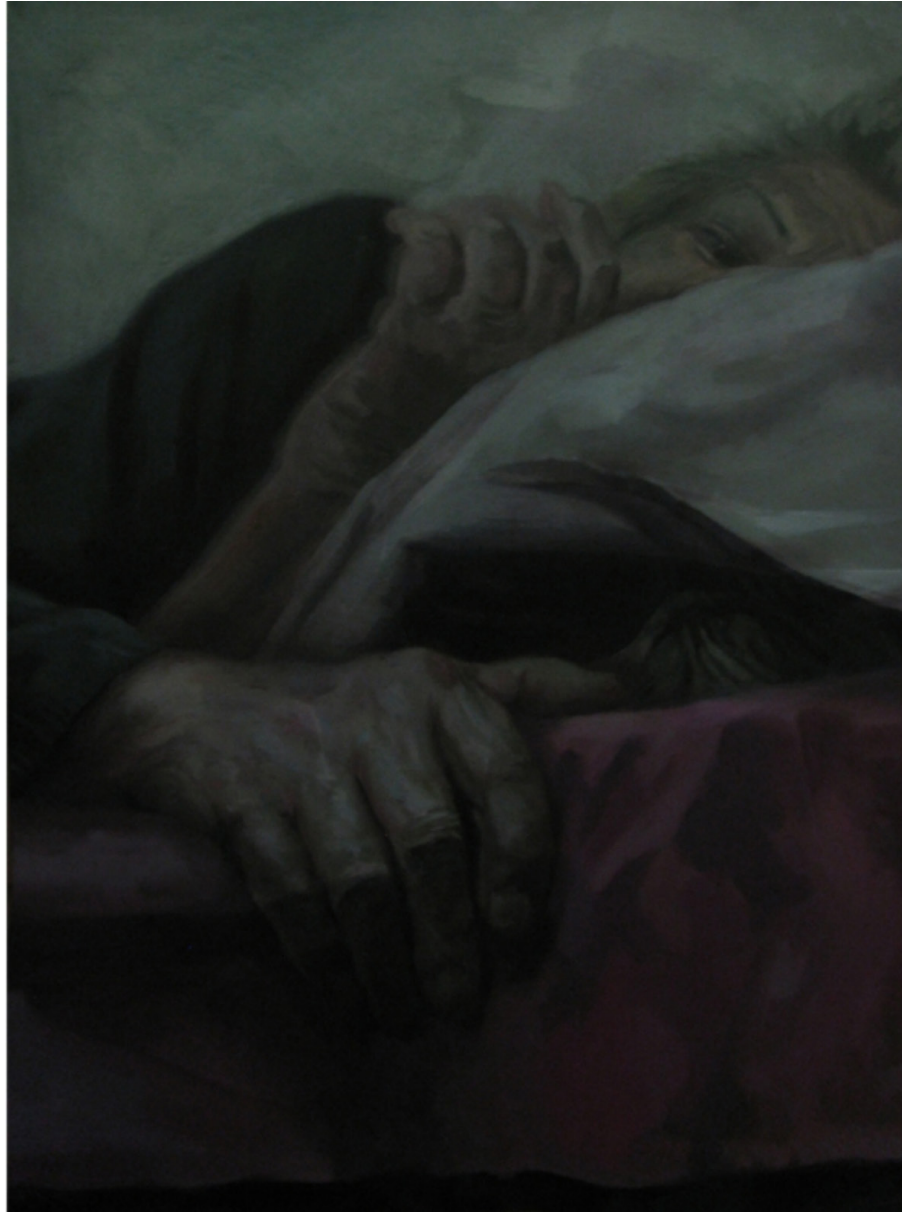
Untitled | Oil on Canvas | 110 x 90 cm