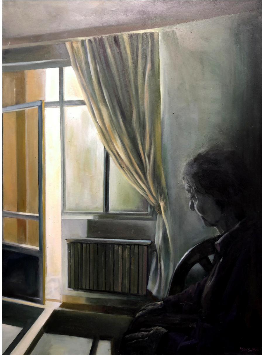
Untitled | Oil on Cardboard | 45 x 26 cm