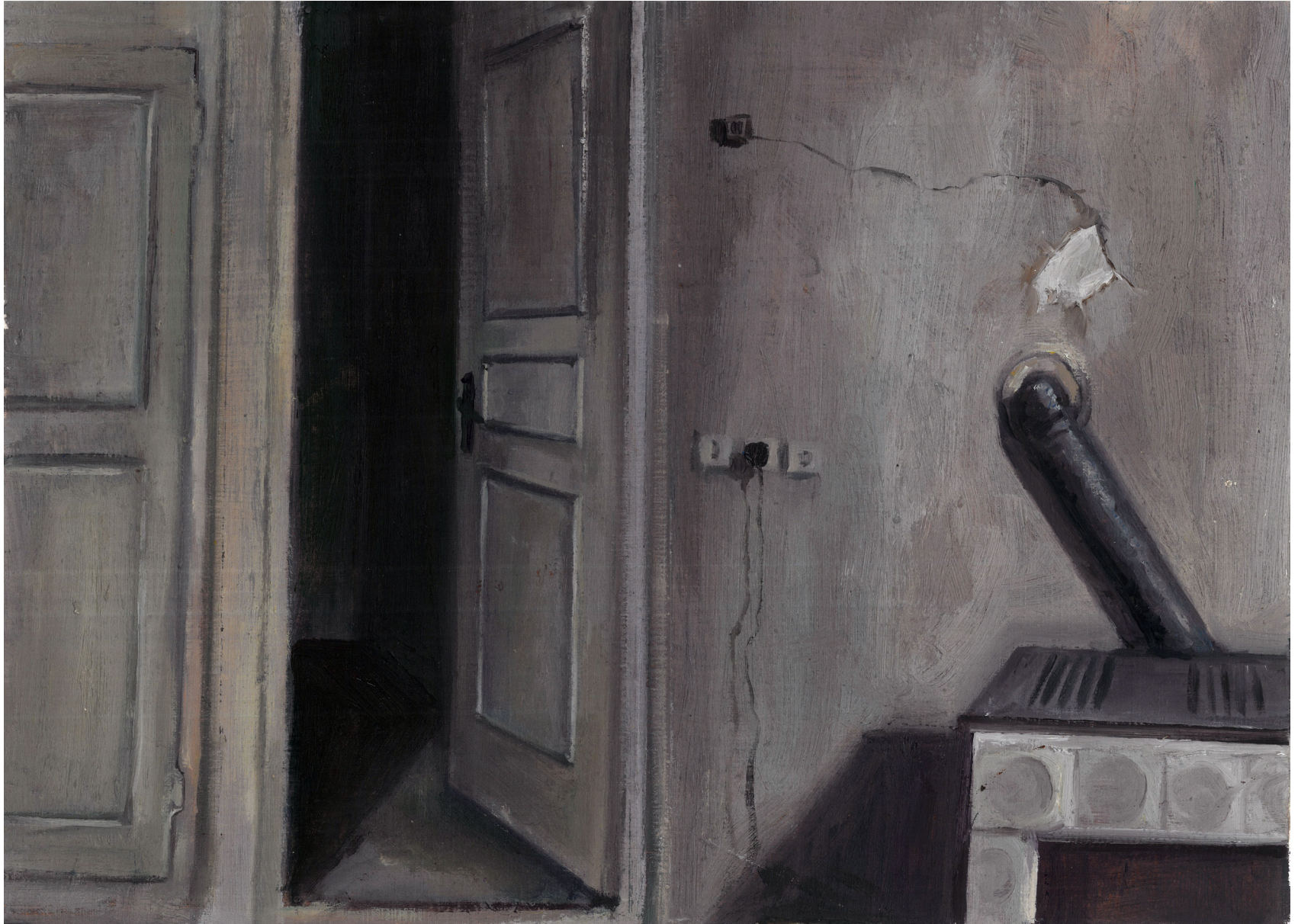
Untitled | Oil on Cardboard | 22 x 30 cm