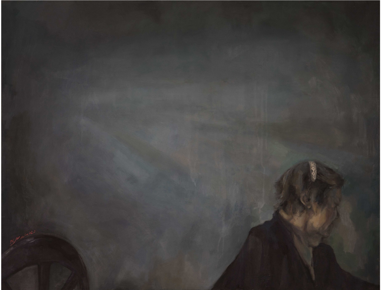
Untitled | Oil on Canvas | 100 x 130 cm