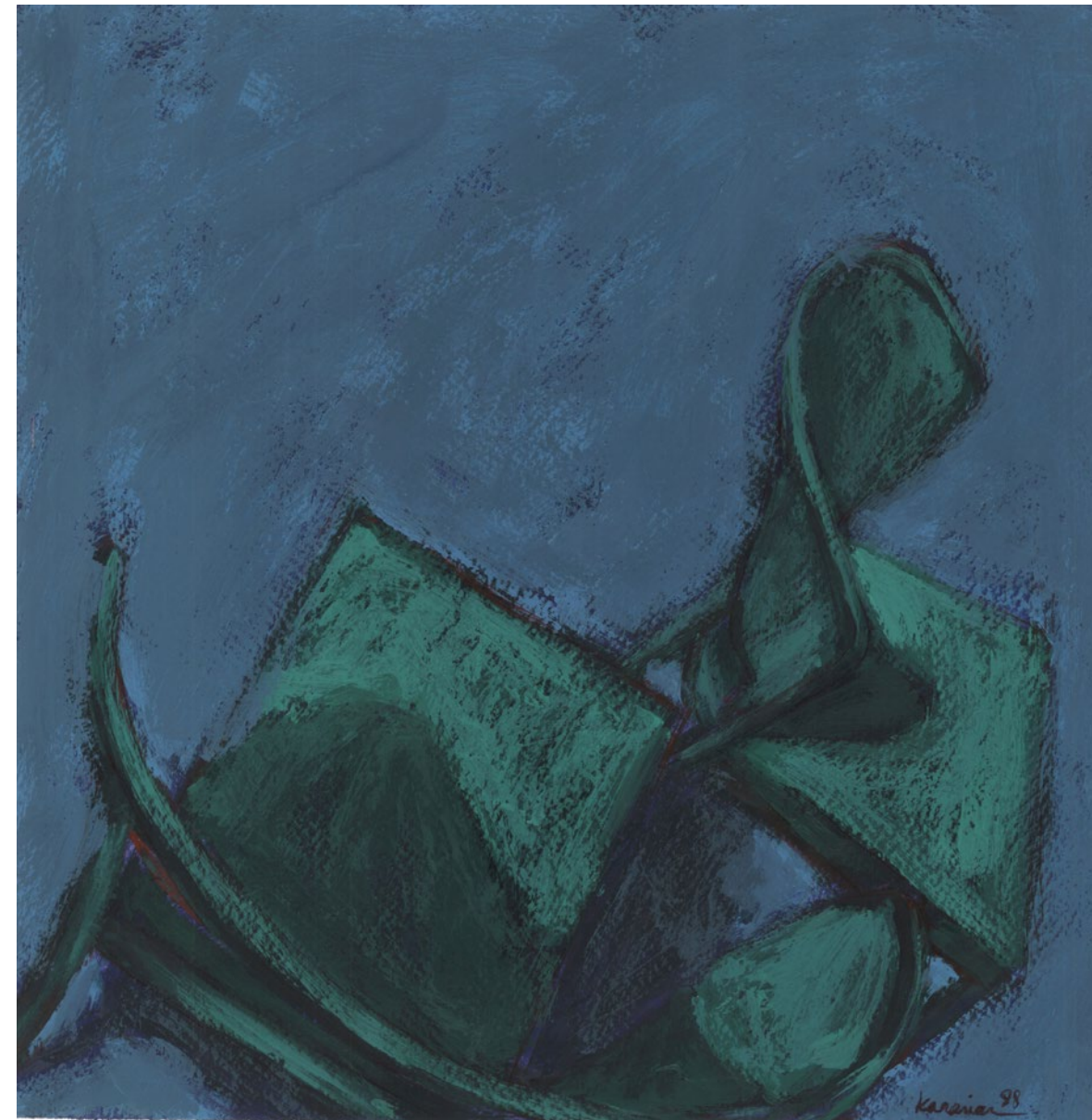
Untitled | Acrylic on Cardboard | 29.5 x 29.5 cm | 2019 | 2.000.000 Toman