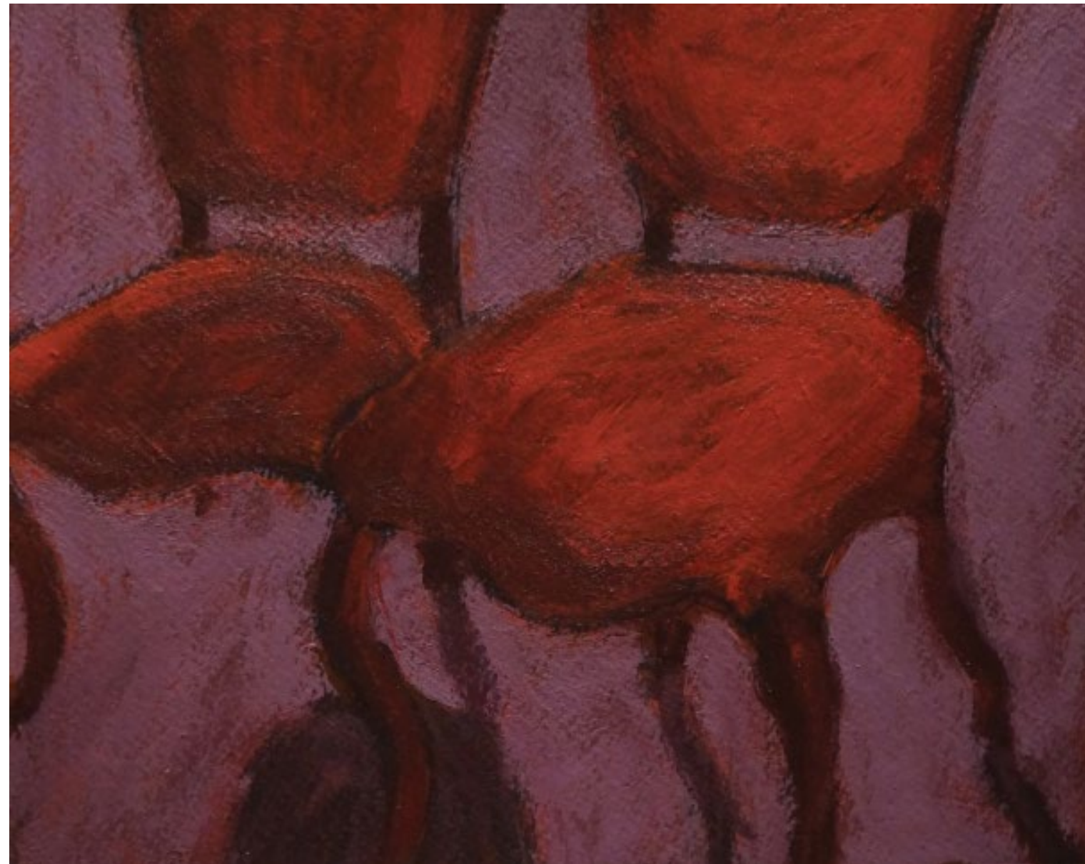
Untitled | Acrylic on Cardboard | 21.5 x 26.5 cm | 2019 | 1.800.000 Toman