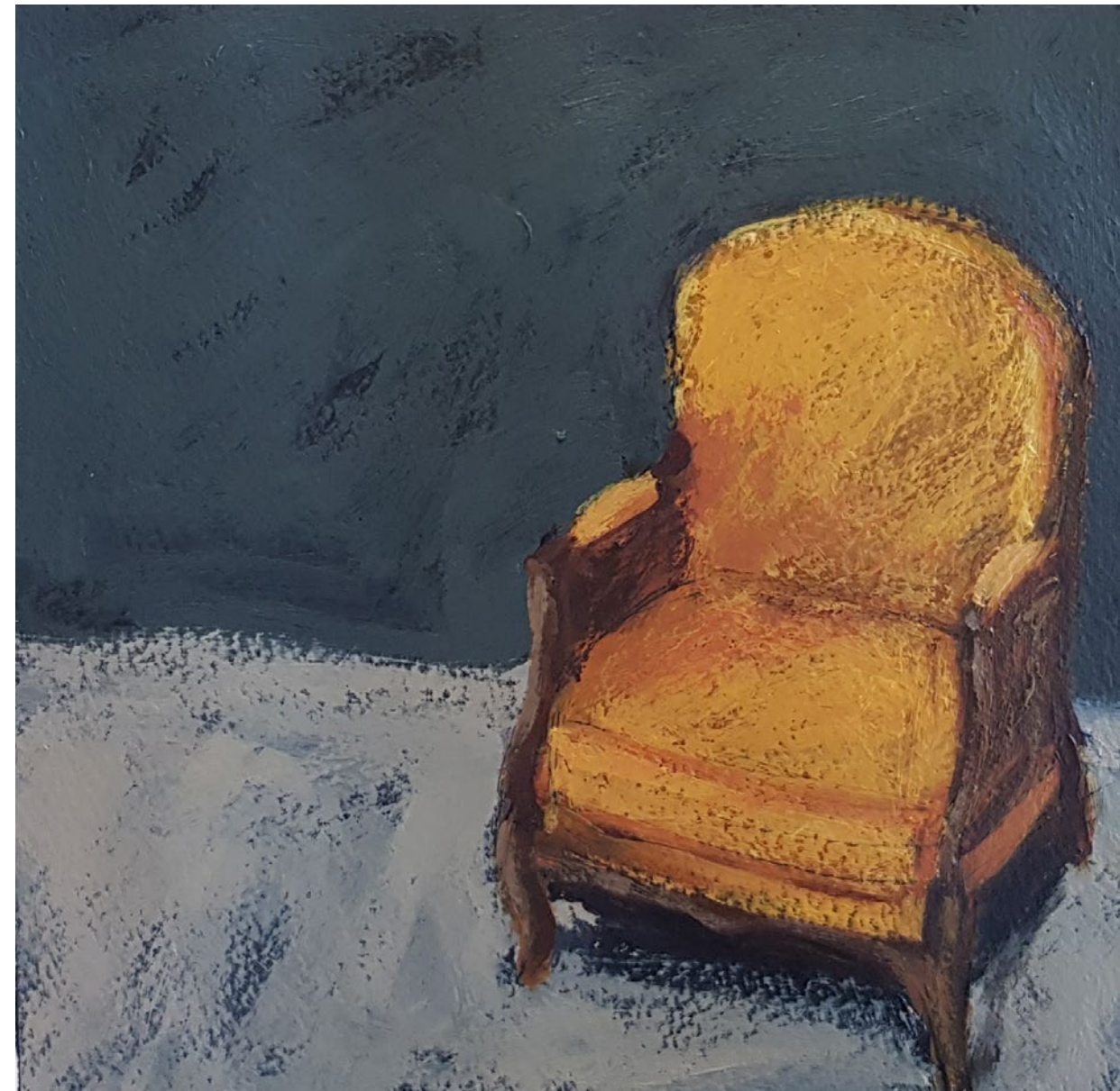
Untitled | Acrylic on Cardboard | 17.5 x 17.5 cm | 2020 | 1.200.000 Toman