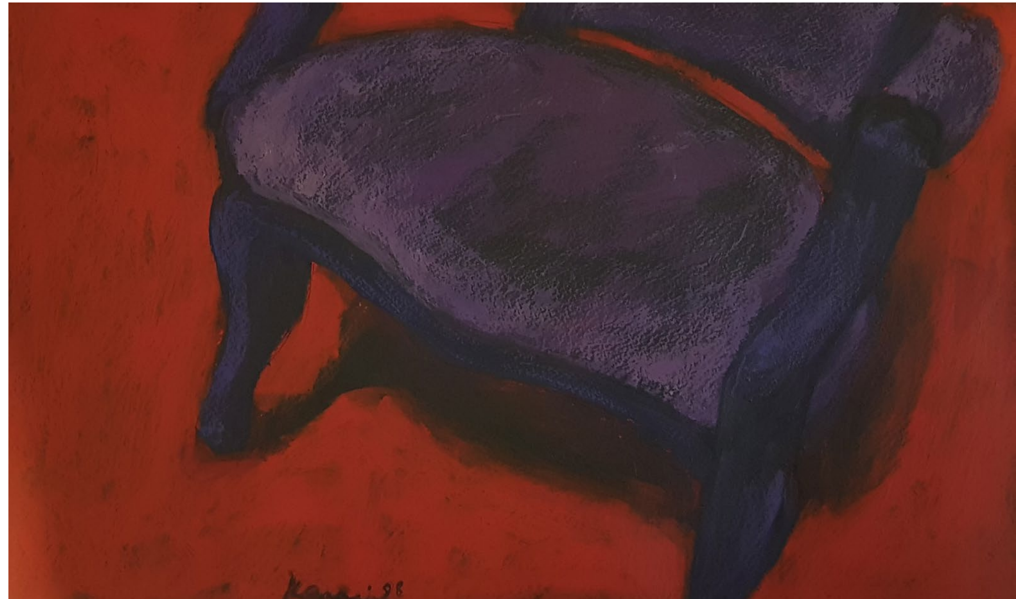
Untitled | Acrylic on Cardboard | 27 x 44.5 cm | 2019 | 2.500.000 Toman