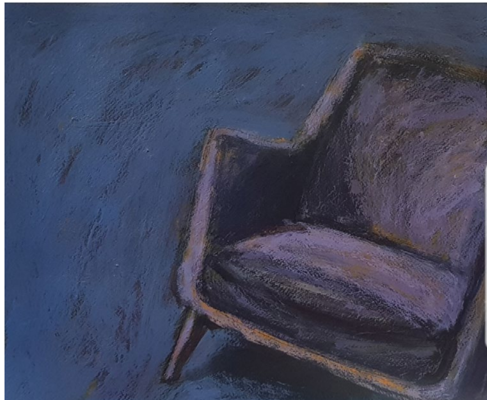
Untitled | Acrylic on Cardboard | 44.5 x 35.5 cm | 2019 | 2.500.000 Toman