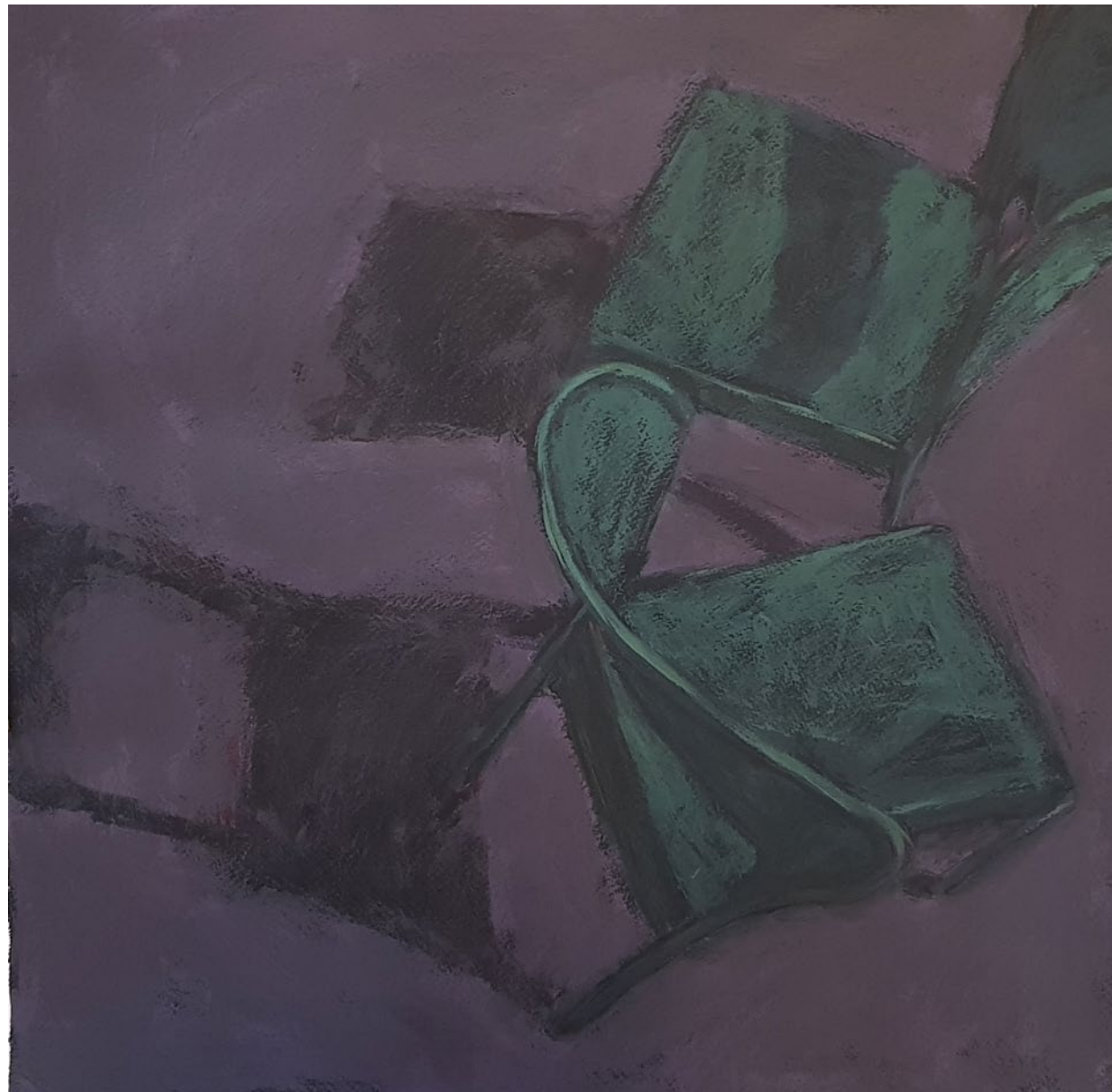
Untitled | Acrylic on Cardboard | 46 x 46 cm | 2020 | 3.500.000 Toman