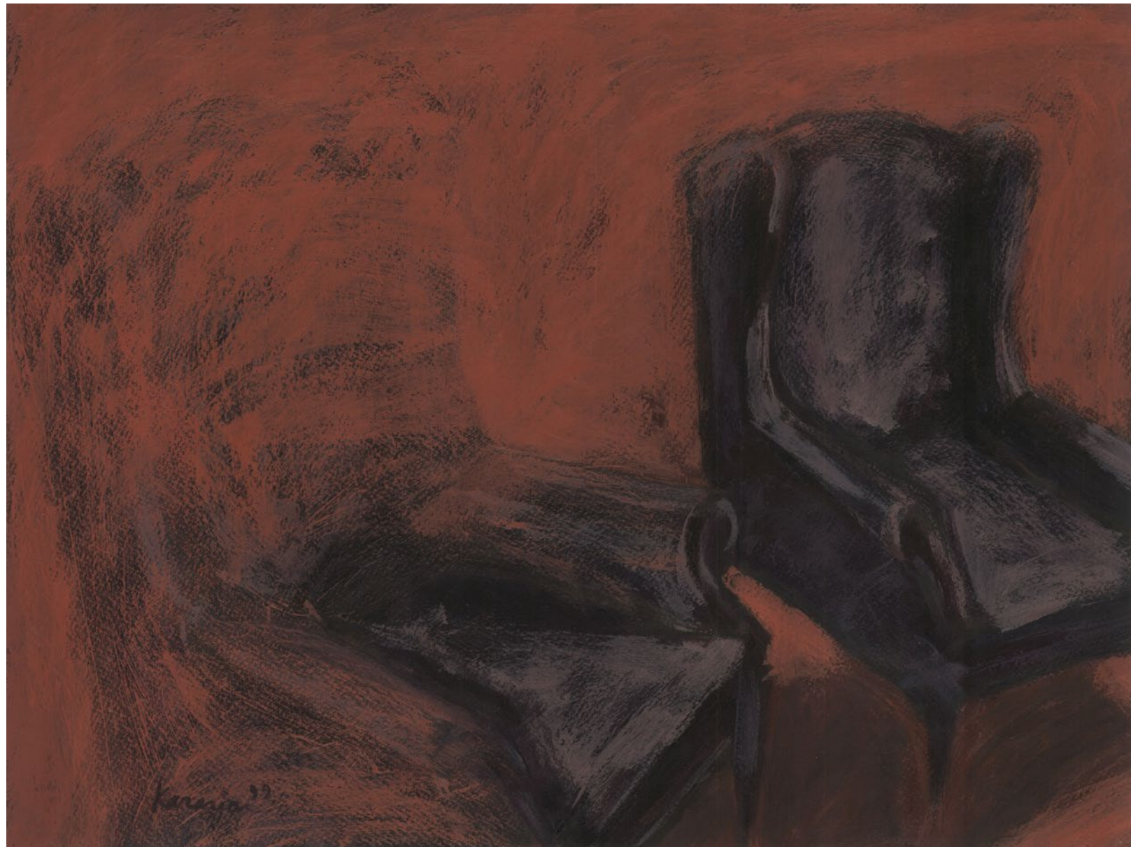
Untitled | Acrylic on Cardboard | 32.5 x 44.5 cm | 2020 | 2.500.000 Toman