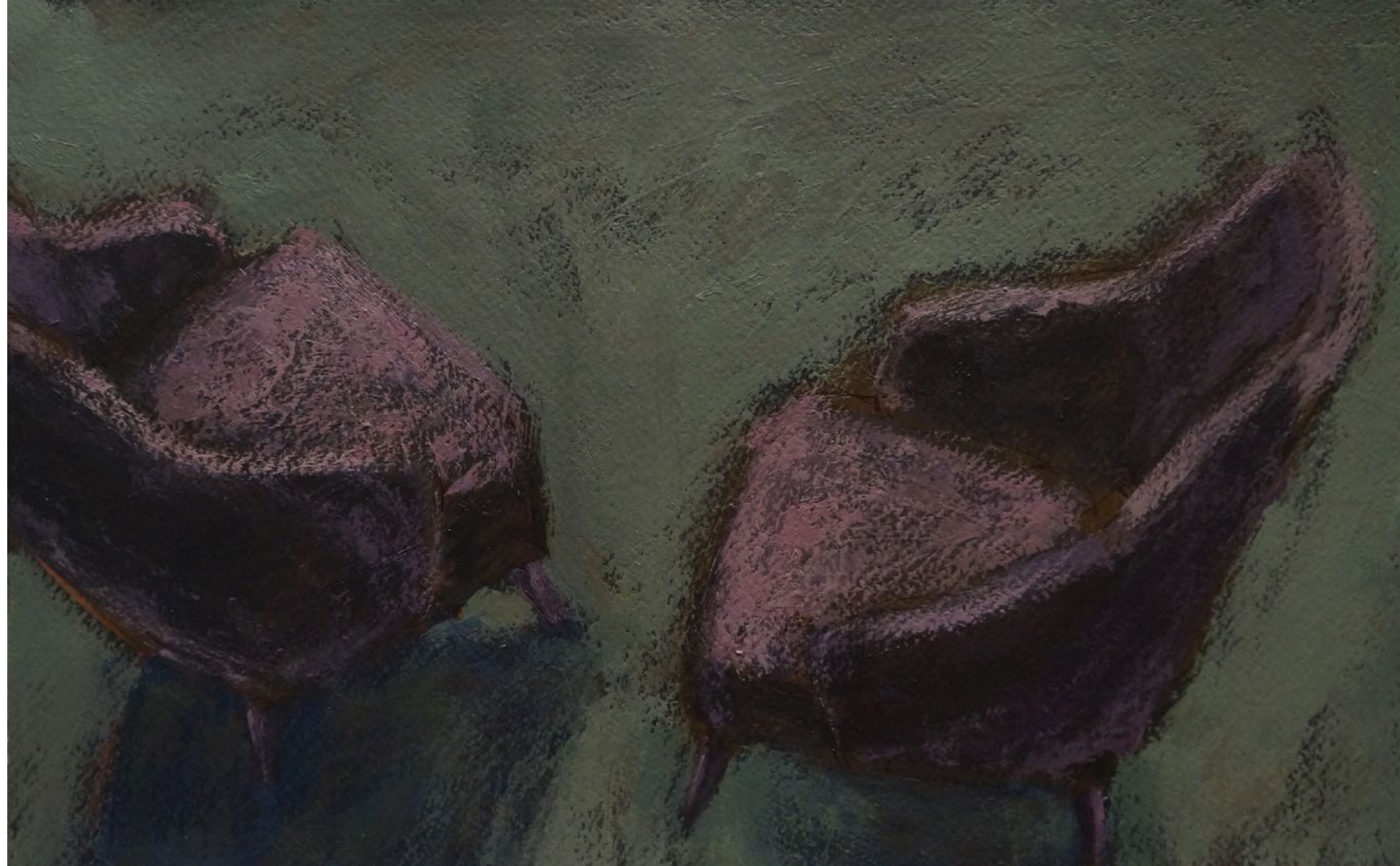
Untitled | Acrylic on Cardboard | 22.5 x 37 cm | 2019 | 2.000.000 Toman