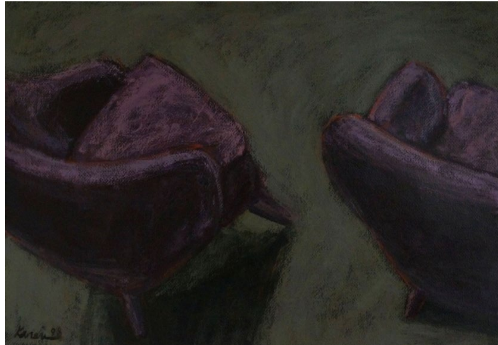
Untitled | Acrylic on Cardboard | 44 x 65 cm | 2019 | 3.500.000 Toman