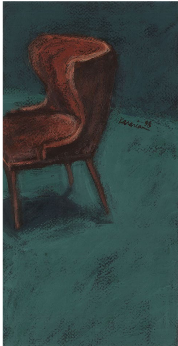
Untitled | Acrylic on Cardboard | 22.5 x 37 cm | 2019 | 1.500.000 Toman