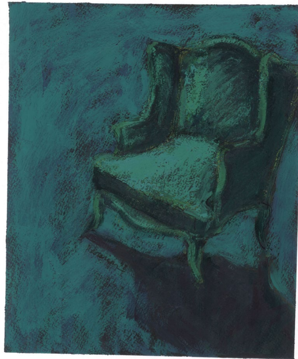
Untitled | Acrylic on Cardboard | 26.5 x 22.5 cm | 2019 | 1.800.000 Toman