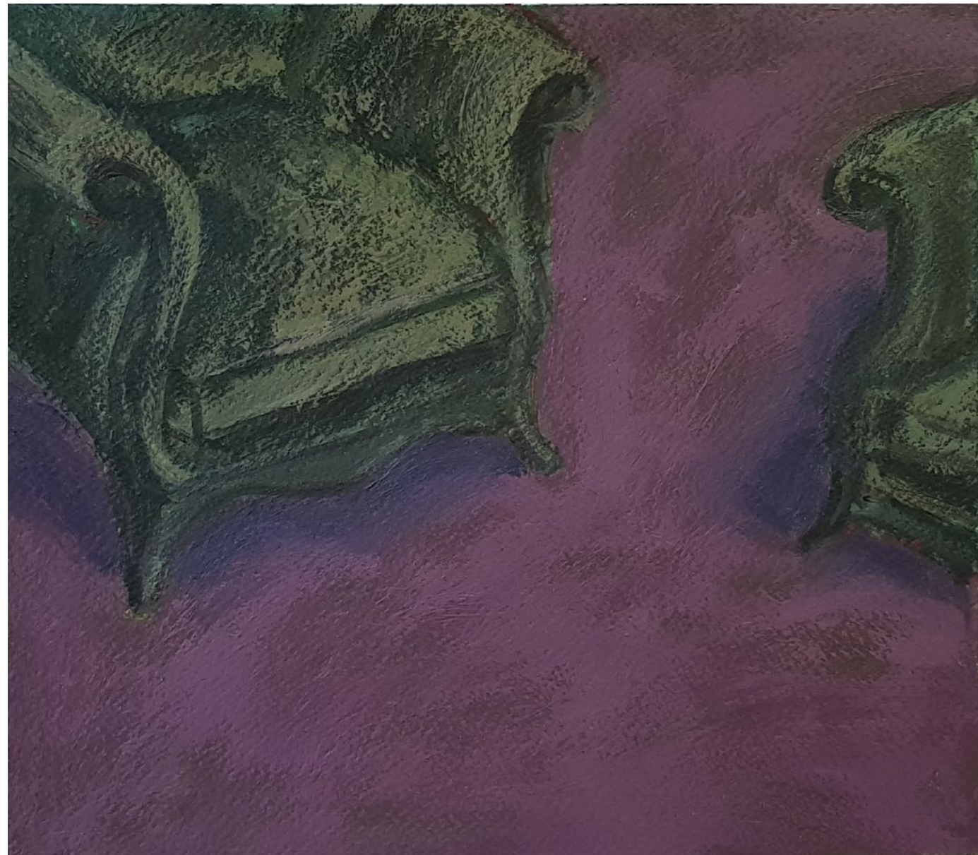
Untitled | Acrylic on Cardboard | 22 x 25.5 cm | 2019 | 1.500.000 Toman