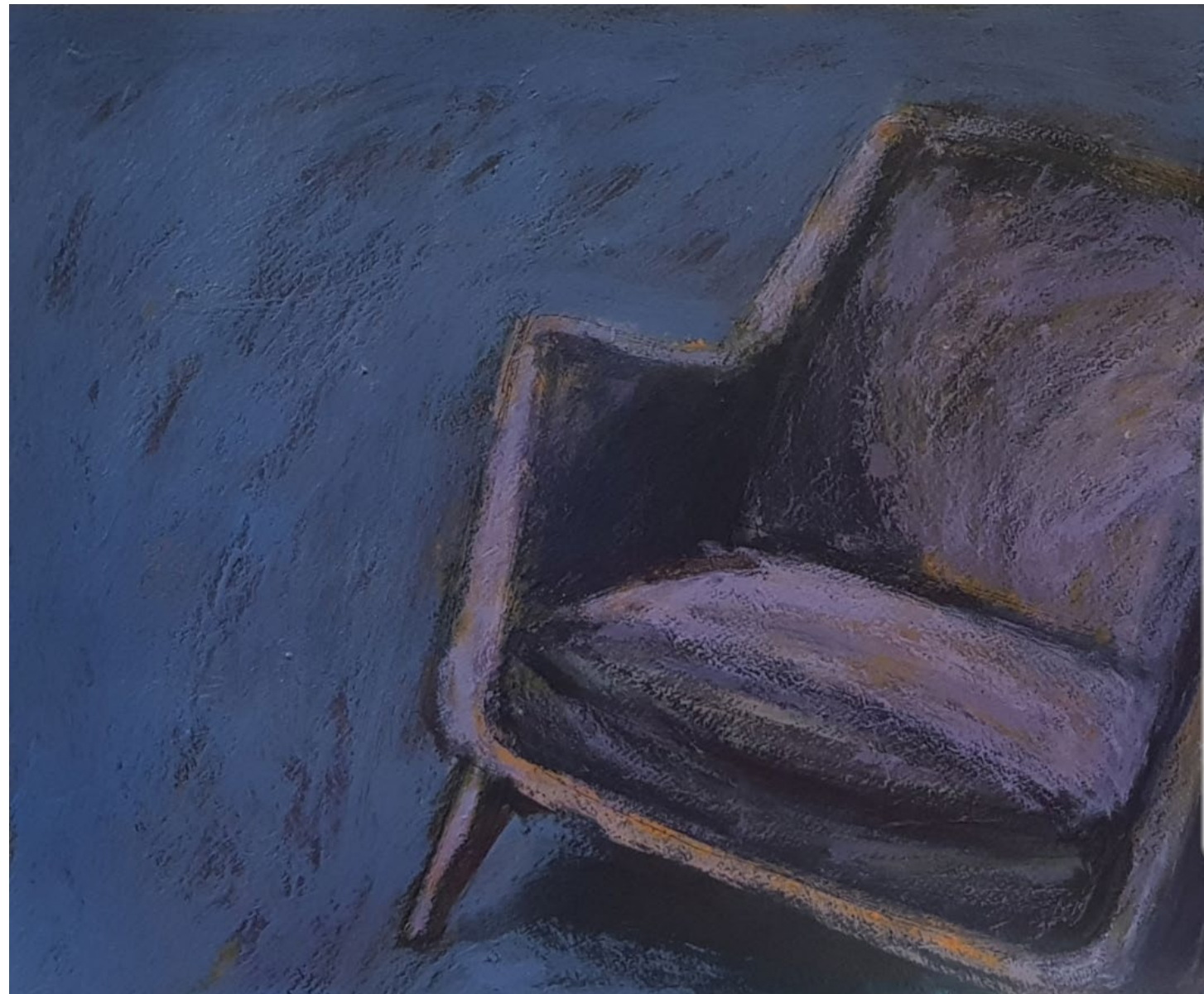
Untitled | Acrylic on Cardboard | 36.5 x 44.5 cm | 2020 | 2.500.000 Toman