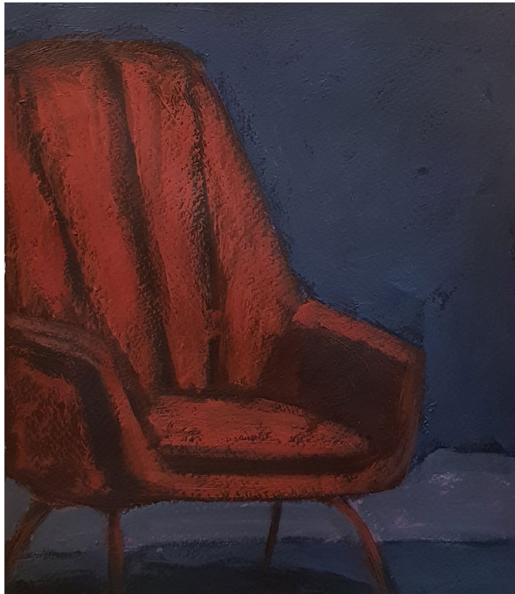
Untitled | Acrylic on Cardboard | 26.5 x 22 cm | 2020 | 1.500.000 Toman