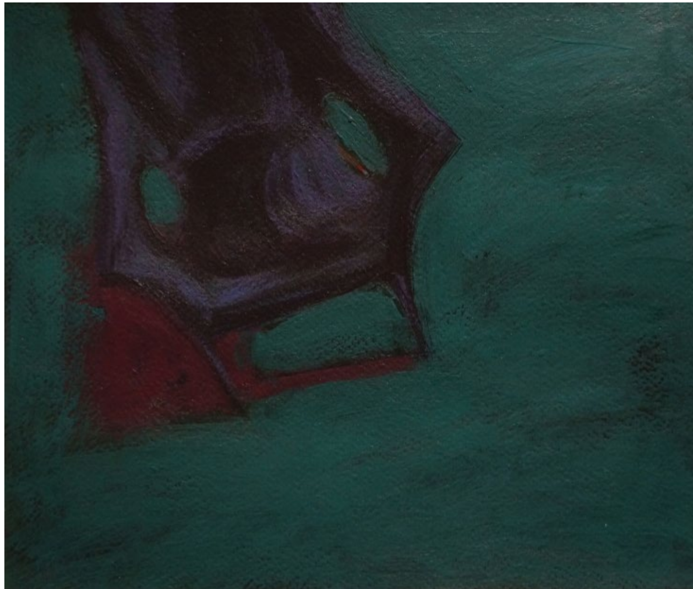
Untitled | Acrylic on Cardboard | 22 x 26.5 cm | 2019 | 1.500.000 Toman