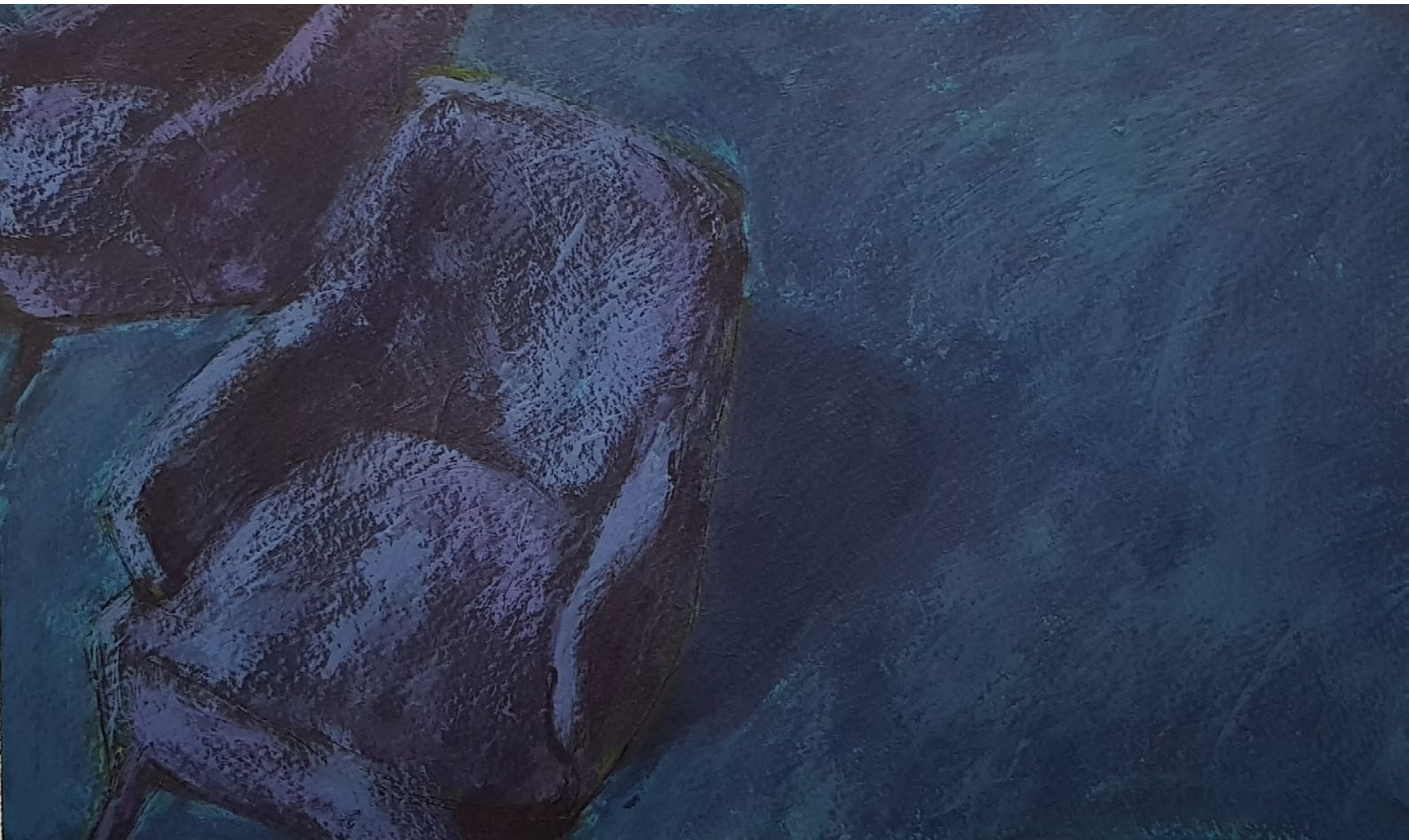
Untitled | Acrylic on Cardboard | 22.5 x 37 cm | 2020 | 1.500.000 Toman